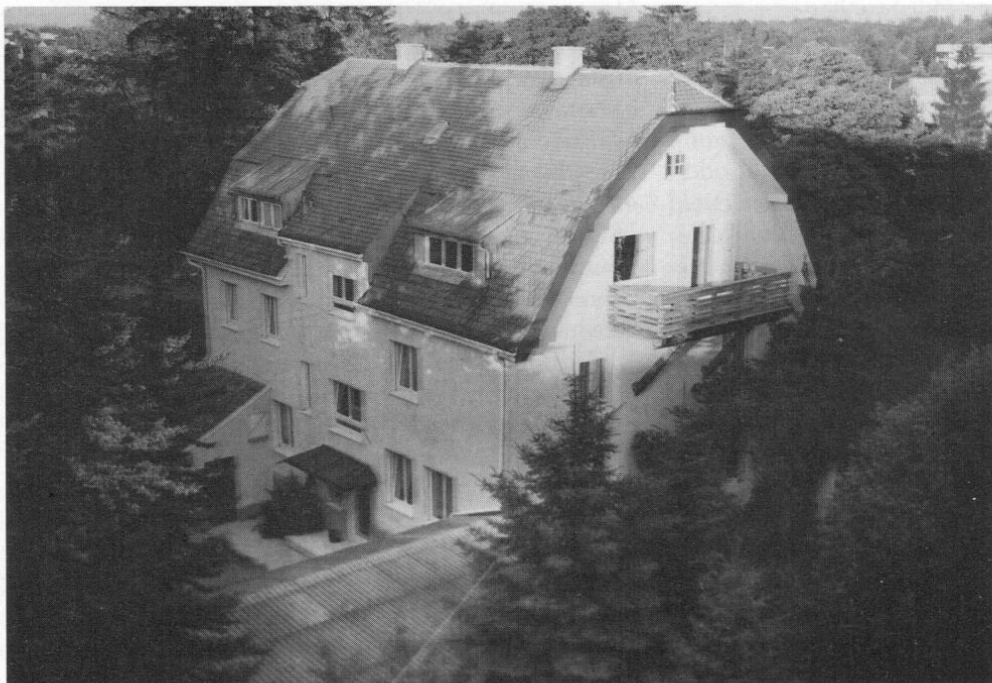
Abb. 1: Das 1911 erbaute Kinderheim in Neu-Esting, wie es ein Jahr vor seinem Abriß aussah.