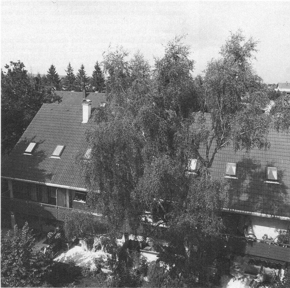
Abb. 5: Gegenwärtiges Aussehen des seit 1975 überbauten Geländes mit Reihenhäusern.