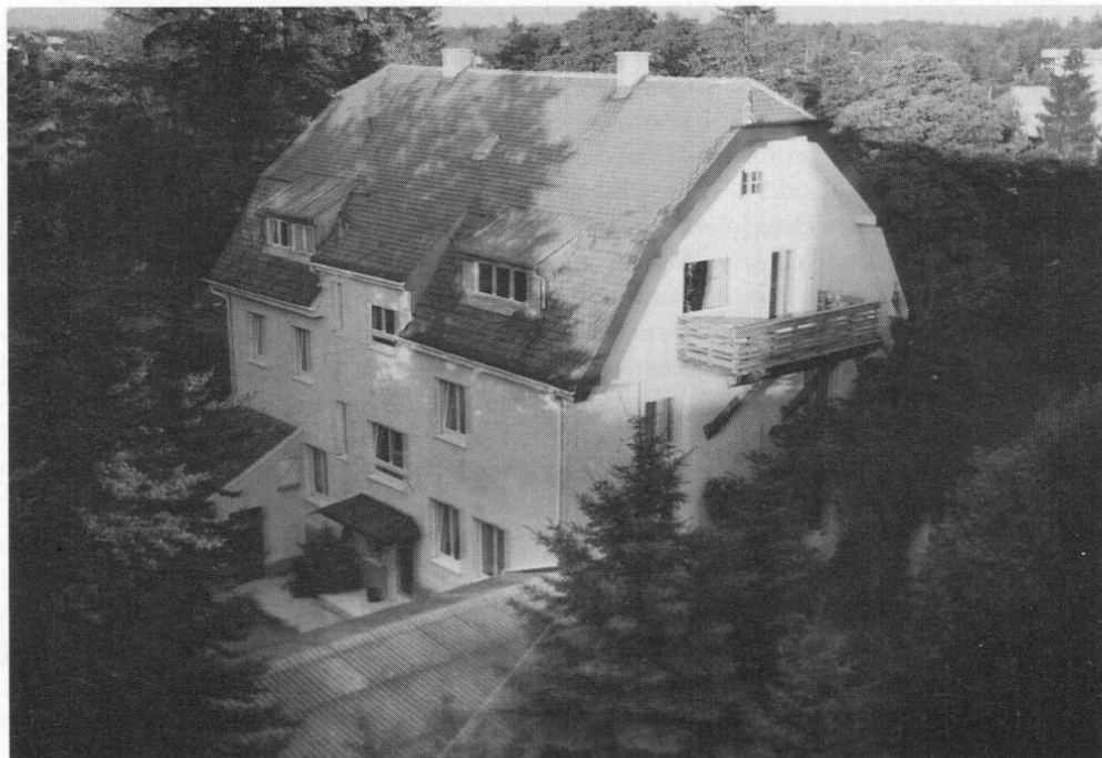
Abb. 1: Das 1911 erbaute Kinderheim in Neu-Esting, wie es ein Jahr vor seinem Abriß aussah.