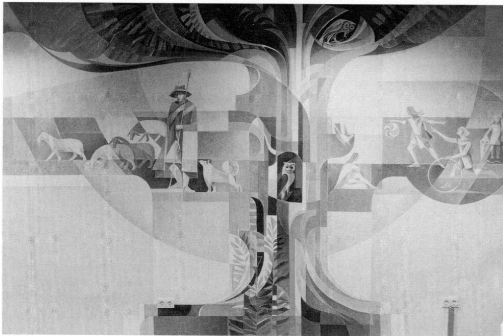
Michael Lutz, Wandgemälde in der Schalterhalle der Sparkasse Eichenau, 1977.