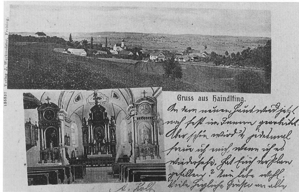
Diese Postkarte von 1910 zeigt Haindlfing von Südosten. In der Mitte die Barockkirche St. Laurentius (um 1740), links oben auf der Anhöhe das Schloß, im Hintergrund das Ampertal.