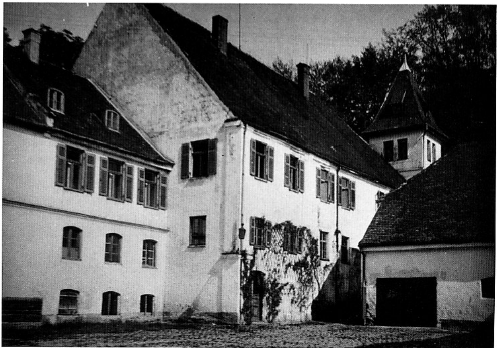
Schloß Thalhausen, Ansicht um 1930.