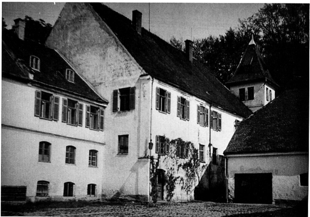
Schloß Thalhausen, Ansicht um 1930.