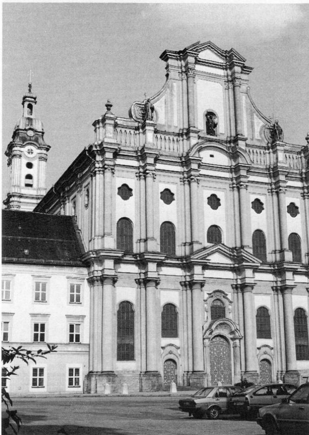
Die ehemalige Zisterzienserklösterkirche Mariae Himmelfahrt, Fürstenfeld. Blick auf die Fassade (von Westen).