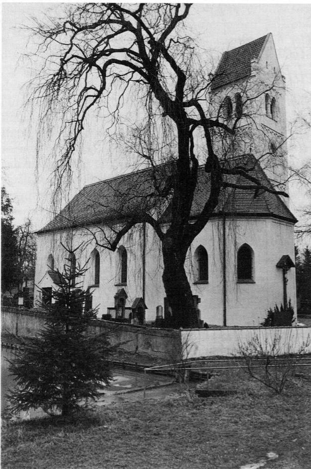
Die alte Brucker Pfarrkirche St. Stephan in Pfaffing.

Diese Auseinandersetzung scheint bis zu den höchsten