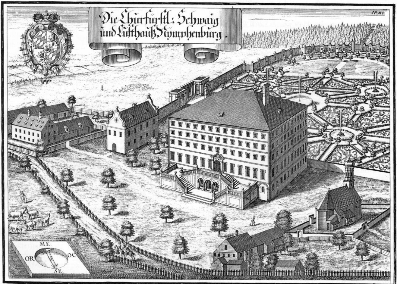
»Die Churfürstl. Schwaig und Lusthauß Nymphenburg«. Kupferstich von Michael Wening, München 1701.

1440 wurde das »Dorfgericht« zu Kemnaten dem Münchner Bürger Ludwig Pötschner und 1467 dem Hans Cleuber verliehen. 10 Dieses muß aber von untergeordneter Bedeutung gewesen sein, denn der Dachauer Landrichter führt 1468 die Bauern Päckl, Thöml, Stro-