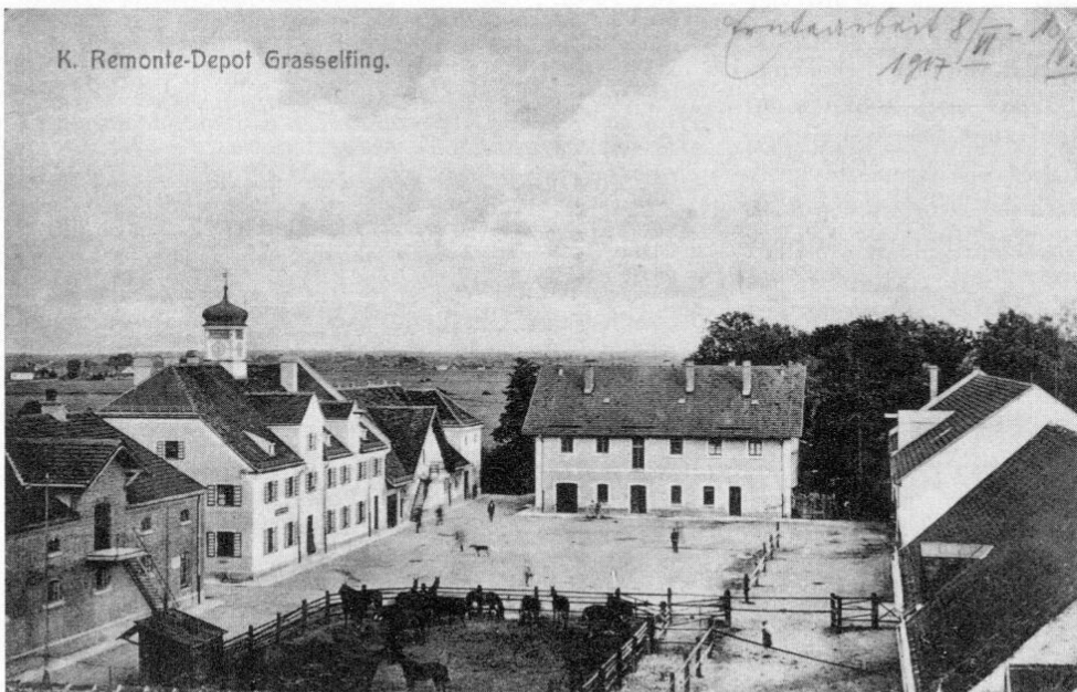
Abb. 3: Remonte-Depot Grasselfing, Lichtdruck-Ansichtskarte (um 1910).

Die wechselvolle Geschichte der ehemals kurfürstlichen Schwaige Graßlfing ist in der Chronik von Geiselbullach