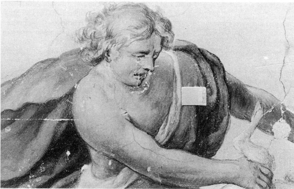
Abb. 2: Ausschnitt aus den Asamfresken im Festsaal des Klosters Fürstenfeld: David hält mit der rechten Hand den Hinterlauf eines Tieres.