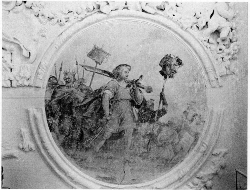
Abb. 3: David im Triumphzug mit dem aufgespießten Haupt des besiegten Goliath.

Zwischendecke horizontal geteilt gewesen sein, denn bereits für das Jahr 1890 findet sich ein Hinweis, daß eine glatte Putzdecke eingezogen worden war. 19 In einem 1909 veröffentlichten Beitrag über den künstlerischen Schmuck des Klosters Fürstenfeld im Brucker Wochenblatt bestätigt Hofkaplan Aumiller den Verlust der Saaldecke, schreibt er doch nach seinem Hinweis auf das von Asam geschaffene Deckenfresko und dessen Bezahlung, daß die Decke nicht mehr vorhanden sei. 20