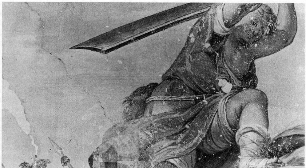
Abb. 1: Ausschnitt aus den Asamfresken im Festsaal des Klosters Fürstenfeld: David schlägt nach dem Sieg mit der Steinschleuder mit voller Wucht das Haupt des Goliath ab.