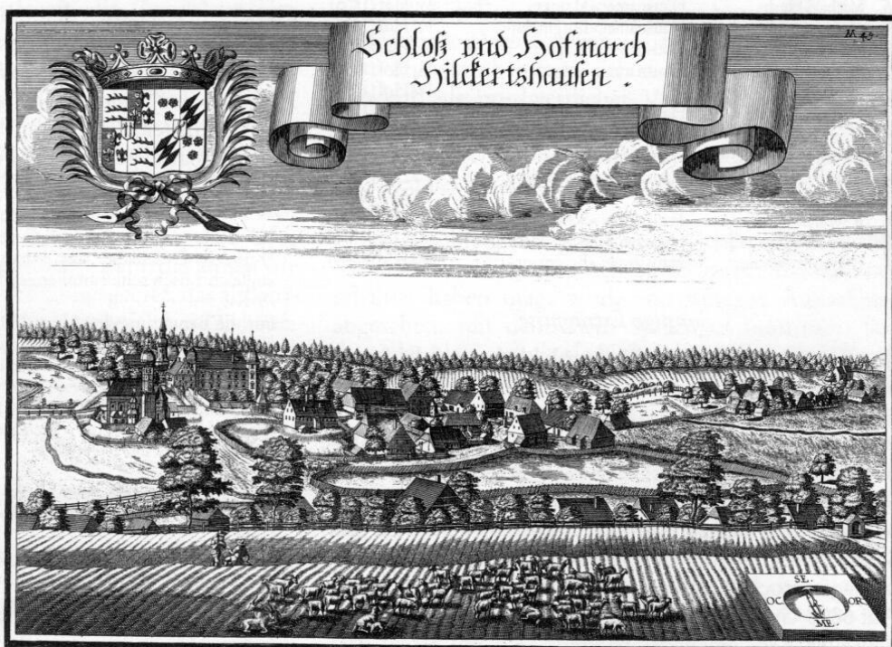
»Schloß und Hofmarch Hilckertshausen«. Kupferstich von Michael Wening, 1701.

(Dorf), Esterhofen (Dorf), Hirschenhausen (Dorf), Badershausen (Dorf) und Schernberg (Einöde). Im folgenden werden die Untertanen der Hauptorte Hilgertshausen und Hirschenhausen geboten. Vorherrschendes Nutzungs- und Leiherecht war die sogenannte veranleitete Freistift. Der Bauer zahlte hier beim Erwerb des Anwesens an den Grundherrn eine feste Summe (Laudemium), die er im Falle einer Aufkündigung (Abstiftung) zurückerhielt. 21 Dies erschwerte die theoretisch jeder Zeit mögliche Kündigung seitens des Grundherrn, so daß das Nutzungsrecht durchaus dem Erbrecht entsprach. Das Dorf Hilgertshausen umfaßte 28 Anwesen. Die Jahreszahl nennt die Anwesenübernahme zu Freistiftrecht wie folgt: