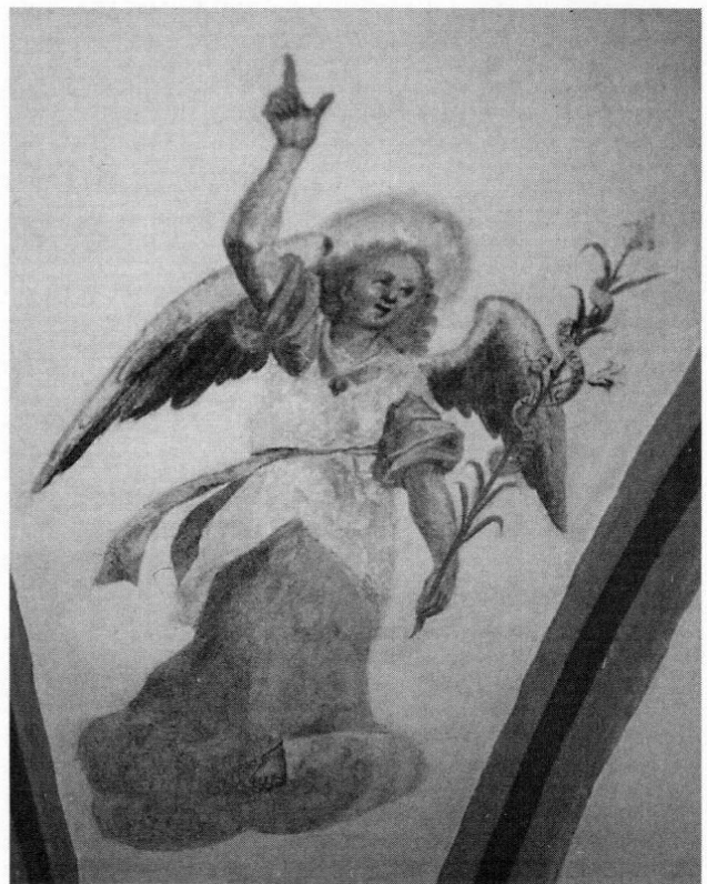
Abb. 6: Verkündigungengel (Nr. 23).

christlichen Symbolen weiterhelfen oder das ausführliche »Lexikon der christlichen Ikonographie« (LCI) (erschieden in acht Bänden im Verlag Herder, Freiburg) die Thematik vertiefen.