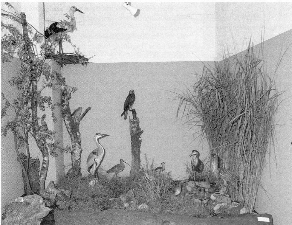
Biotop mit ausgestorbenen Vogelarten (Bezirksmuseum, Raum 1).

Seit etwa 200 Jahren siedelt nun der Mensch im Moos und verändert es nach seinen Bedürfnissen. Von der ursprünglichen Naturlandschaft sind heute nur mehr Kleinstflächen übrig. Die moderne Landwirtschaft, dichte Wohn- und Gewerbegebiete, großräumige Verkehrsstraßen, Sport- und Erholungsanlagen bestimmen das heutige Bild vom Dachauer Moos.