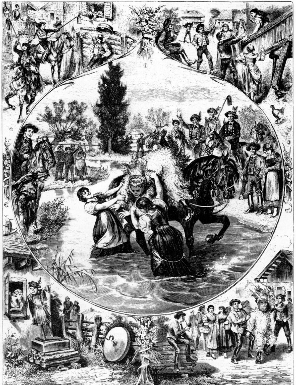
Pfingstbrauchtum in Bayern. Nach einer Skizze von G. Knapp auf Holz gezeichnet von Franz Kollarz.

Nach Hans Moser 12 standen sie im Zusammenhang »mit dem unter anderem in Niederbayern belegten Grenzzumritt zu Pfingsten, den man »Wasservogel« nannte . Er diente der Bestätigung der Jurisdiktion und es mußten alle Bauern der Herrschaft daran teilnehmen, so daß stets ein Zug von etlichen hundert Männern zustandekam. Mit diesem Rechtsbrauch waren aber auch rein volksbrauchtümliche Elemente verbunden, denen er ja schon seinen Namen verdankte, das Herumführen des Wasservogels, der in Laub gekleideten vegetationskultischen Pfingstgestalt, [die mit Wasser begossen und zum Abschluß der