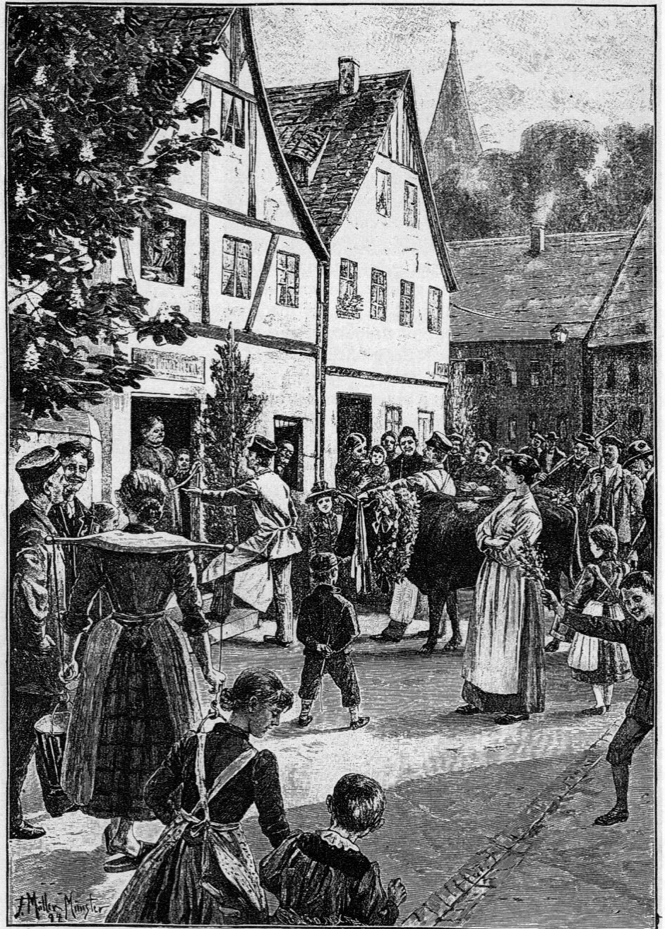
Der Umzug des Pfingstochsen in Mecklenburg, 1894. Nach einer Zeichnung von F. Müller-Münster.

Nach dem angeführten Bericht J. A. Schmellers wurde vielfach »der am spätesten zurechtgekommene Bursche« zum Pfingstl bzw. Wasservogel auserkoren, der sich der nicht eben angenehmen Prozedur, ins Wasser geworfen zu werden, unterziehen mußte. Häufig war es jener, der am Pfingstsonntag als letzter zum Gottesdienst erschienen war. Er wurde, wie der am Palmsonntag zuletzt aus den Federn gekrochene Langschläfer als »Palmesel«, als »Pfingstochse« verspottet. Dies geht auf den weit verbreiteten Brauch zurück, am Pfingstsonntag den schönsten,