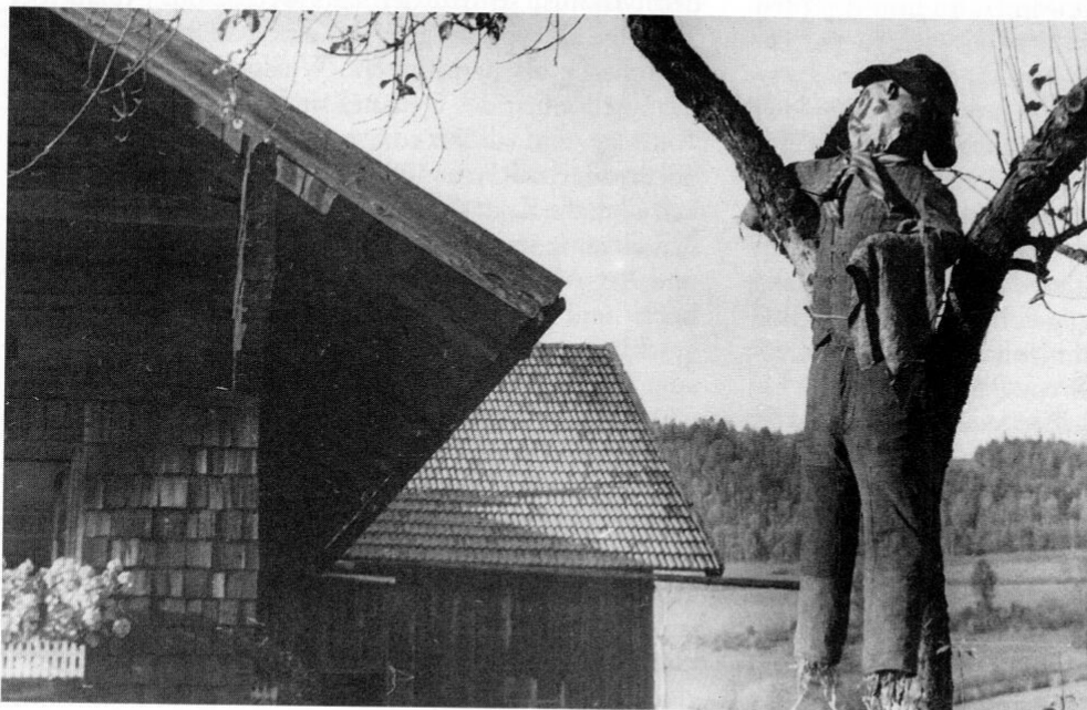
Pfingstlummel aus Schönau im Bayerischen Wald, um 1938.