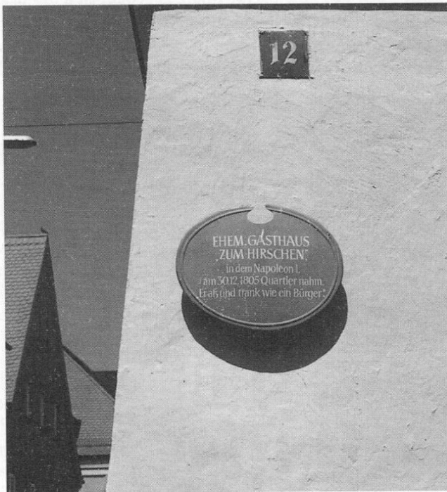
Erinnerungsschild am Haus Hauptstraße 12 in Freising: Ehemaliges Gasthaus »Zum Hirschen«, in dem Napoleon I. am 30. 12. 1805 Quartier nahm. »Er aß und trank wie ein Bürger.«