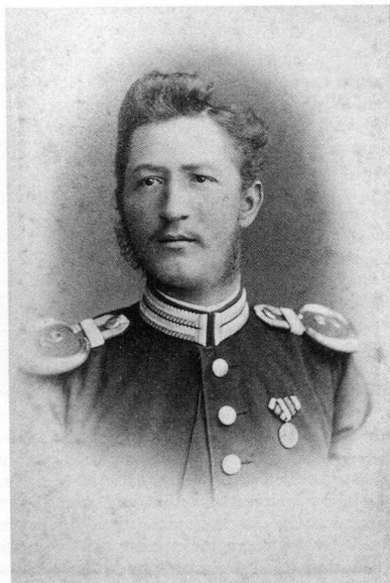
Gustav Medicus (1821–1883), der Gründer der München-Dachauer Aktiengesellschaft für Maschinenpapierfabrikation als Hauptmann de La suite.

2 StadtADah Magistratsprotokoll v. 11. 3. 1840 S. 31.