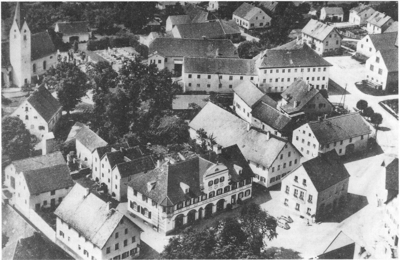
Der Kern des Marktes Indersdorf ist hier abgebildet. Vorn in der Mitte der Marktplatz, rechts davon das Rathaus, das jahrzehntelang auch das Domizil der Sparkasse war. Das stattliche Gebäude im Vordergrund in der Mitte ist das frühere Kaufhaus Holdenried. Der linke Teil dieses großen Hauses steht auf dem Platz, auf dem einst das »Bräuhöfl« des Brauers Zangmeister stand (siehe den Bericht über Zangmeister in diesem Heft). Bild über das frühere Aussehen dieser beiden Häuser siehe Amperland 1985–1987, S. 184. Die weiteren ehemaligen Zangmeistergrundstücke sind im Hintergrund zu sehen: rechts oben der zur ehemaligen Brauerei gehörende Bauernhof (heute Reischl), links davon die beiden großen und zusammengebauten Häuser stehen auf dem Grund der ehemaligen Brauerei Zangmeister (heute Gasthaus Steidle). Aufnahme um 1960.

einer Währung. Am 9. Juli 1873 hatte der Reichstag die Einführung der Markwährung im Deutschen Reich beschlossen. Also mußten in Bayern die Gulden- auf die Markbeträge umgestellt werden.