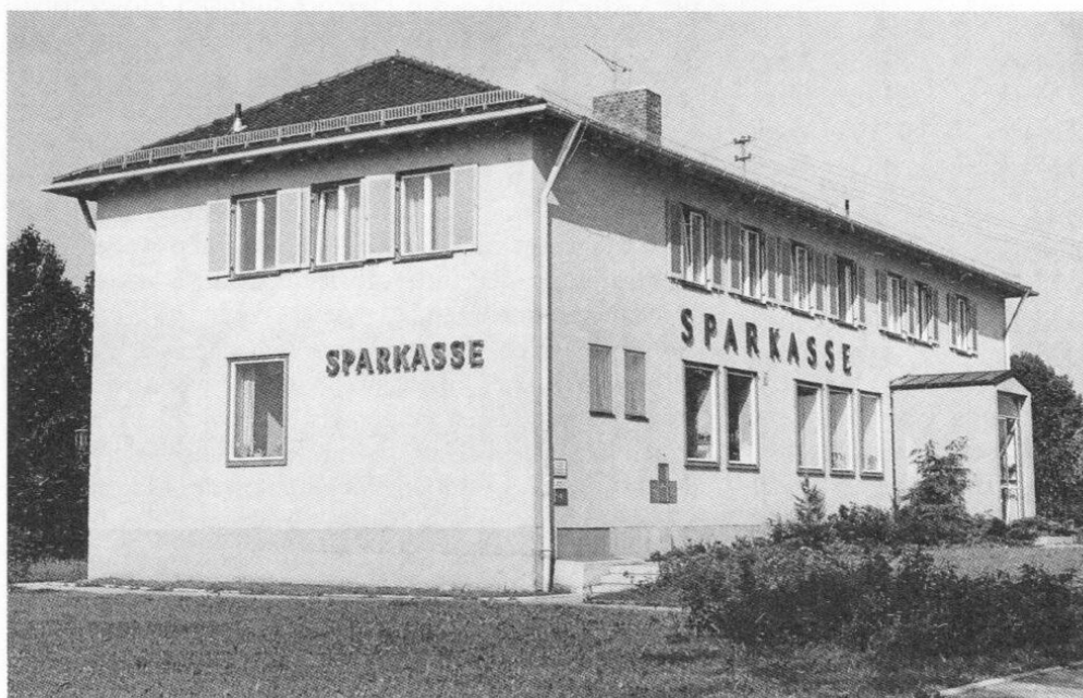
Die Sparkassengeschäftsstelle Indersdorf nach ihrer Eröffnung im Jahre 1960