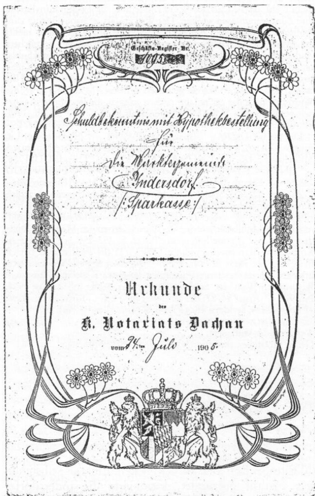
Handgeschrieben waren in den ersten Jahrzehnten die Hypothekenurkunden der gemeindlichen Sparkasse Indersdorf. Die Darlehensnehmer bekamen »von der Marktgemeinde Indersdorf aus Mitteln der dortigen Sparkasse« ihre Darlehen.

Die Zeitumstände drücken sich auch darin aus, daß einmal ein Bauer eines bekannten Bauernhofes aus der Nähe von Indersdorf für die Zinsen seines Darlehens statt Geld ein Spanferkel hingab. Natürlich sind auch die üblichen Gründe für Darlehensaufnahmen wie Ausheiratung der Tochter, Kauf von Betriebsmitteln, Kauf von Grundstücken u. a. in den Unterlagen genannt. Ein weiteres Ereignis geht aus diesem Büchlein hervor, das bald wieder Wirklichkeit werden könnte: die Umstellung