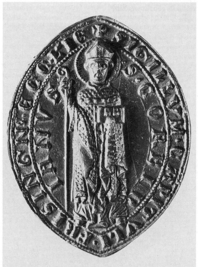
Das große ovale Siegel des Freisinger Domkapitels zeigt den heiligen Korbinian. Es war vom 14. bis Ende des 17. Jahrhunderts in Gebrauch.

Älteste Aufgabe der Domkleriker war es gewesen, den Bischof bei den Gottesdiensten in der Domkirche zu unterstützen. Ebenso standen sie ihm bei Schenkungen an die Kathedrale als Zeugen zur Seite. Schon früh allerdings entwickelte sich daraus ein Zustimmungsrecht zu bestimmten bischöflichen Rechtsgeschäften. Zudem verfügte die Gemeinschaft der Domkanoniker zu ihrem