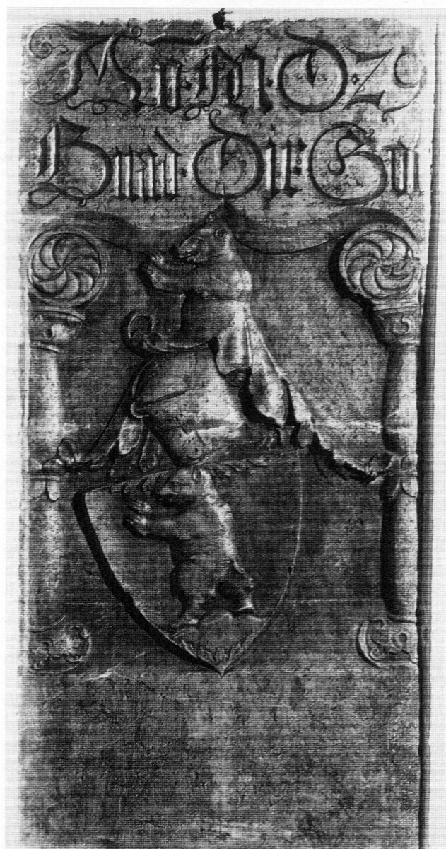
Freising, Pfarrkirche St. Georg, Wappengrabplatte (1529). Inskriptionskommission München H. S. XIII/35.