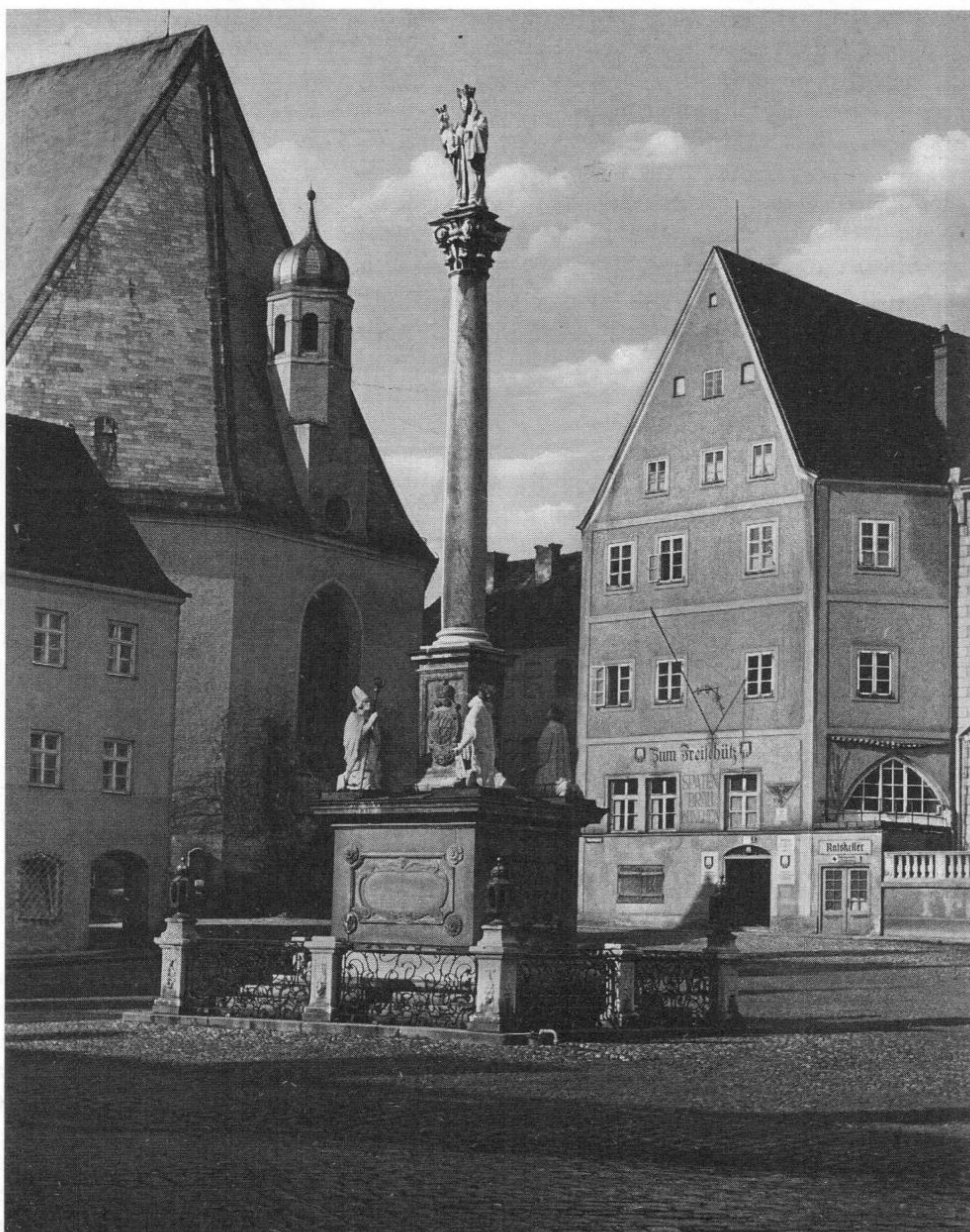
Freisinger Mariensäule, 1674 von Bischof Albrecht Sigismund (1652 bis 1685) errichtet, 1859 von den Brüdern Max und Ignaz Einsele restauriert.

Der Ruf Einseles um eine Zulage blieb nicht ungehört.