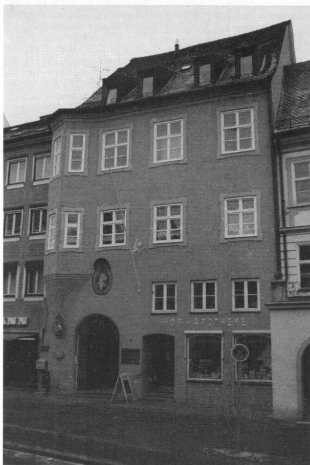
Das »Hofkanzlerhaus« in der Unteren Hauptstraße in Freising, Wohnsitz der Familie Frey.