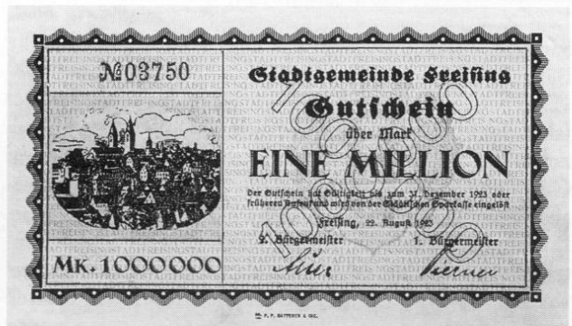
Stadt Freising, Notgeld über eine Million Mark, 88 × 149 mm.