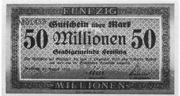
Stadt Freising, Notgeld über 50 Millionen Mark, 84 × 150 mm.

mehr mit dem Drucken der Inflationsscheine nachkommen und dadurch eine Papiergeldknappheit herrschte, wurden auch von der Stadt Freising, der Stadt Moosburg und von verschiedenen Firmen und Banken kurzfristig Notgeldscheine und Werkschecks als Zahlungsmittel gedruckt und ausgegeben. Im Freisinger Tagblatt finden sich hierzu folgende interessante Hinweise: