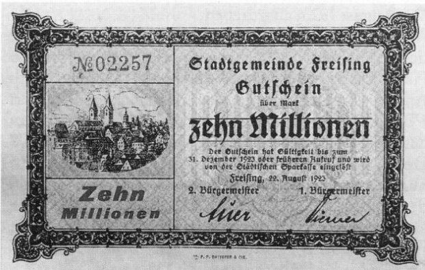
Stadt Freising, Notgeld über 10 Millionen Mark, 84 × 128 mm.