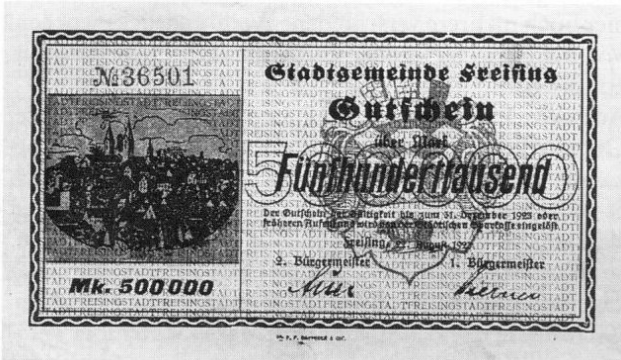
Stadt Freising, Notgeld über 500000 Mark, 90 × 150 mm.