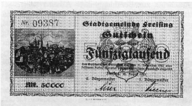
Stadt Freising, Notgeld über 50000 Mark, 87 × 150 mm.