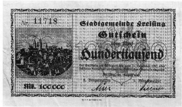
Stadt Freising, Notgeld über 100000 Mark, 87 × 150 mm.