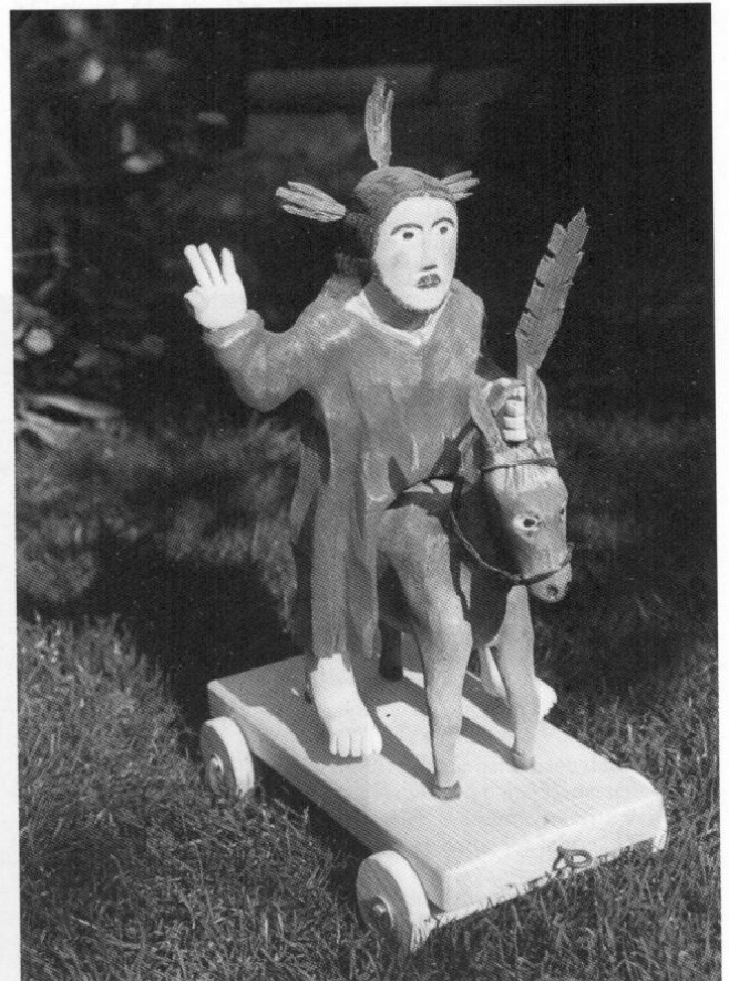
Abb. 4: Palmesel von Michael Kaindl 1995.