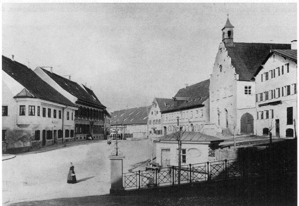
Der Dachauer Marktplatz um 1890. Links die beiden alten Weintafernwirtschaften, hinter dem Rathaus die Brauerei Zieglerbräu.