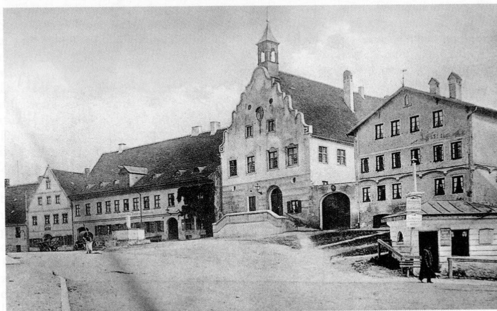
Der Zieglerbräu und das Rathaus vor 1914. Der Marktbrunnen wurde im Juni 1914 in die Augsburger Straße versetzt.