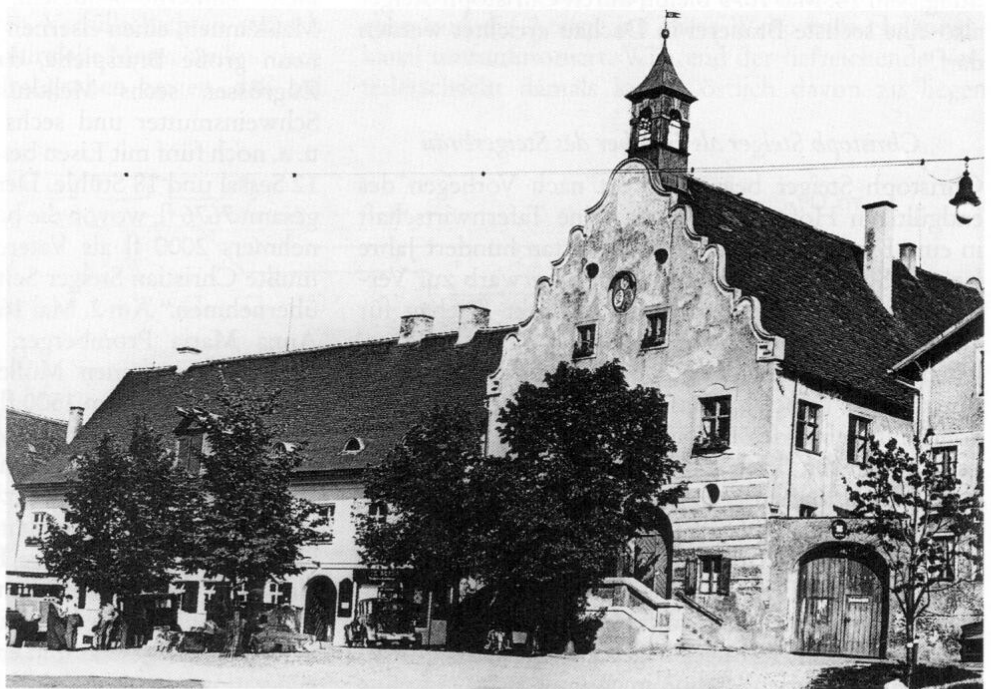
Der Zieglerbräu und das Rathaus zwischen 1930 und 1933. Ganz links ein Autobus der Linie Dachau-Freising oder Dachau-Fürstenfeldbruck, die beide in der ersten Jahreshälfte 1930 eingerichtet wurden.