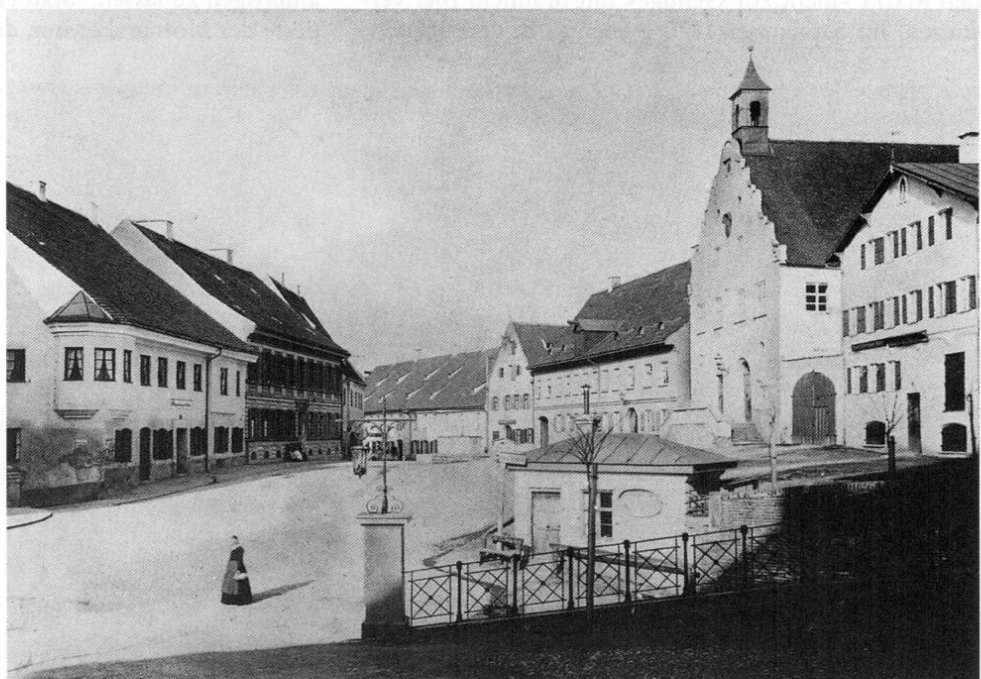
Der Dachauer Marktplatz um 1890. Links die beiden alten Weintafernwirtschaften, hinter dem Rathaus die Brauerei Zieglerbräu.