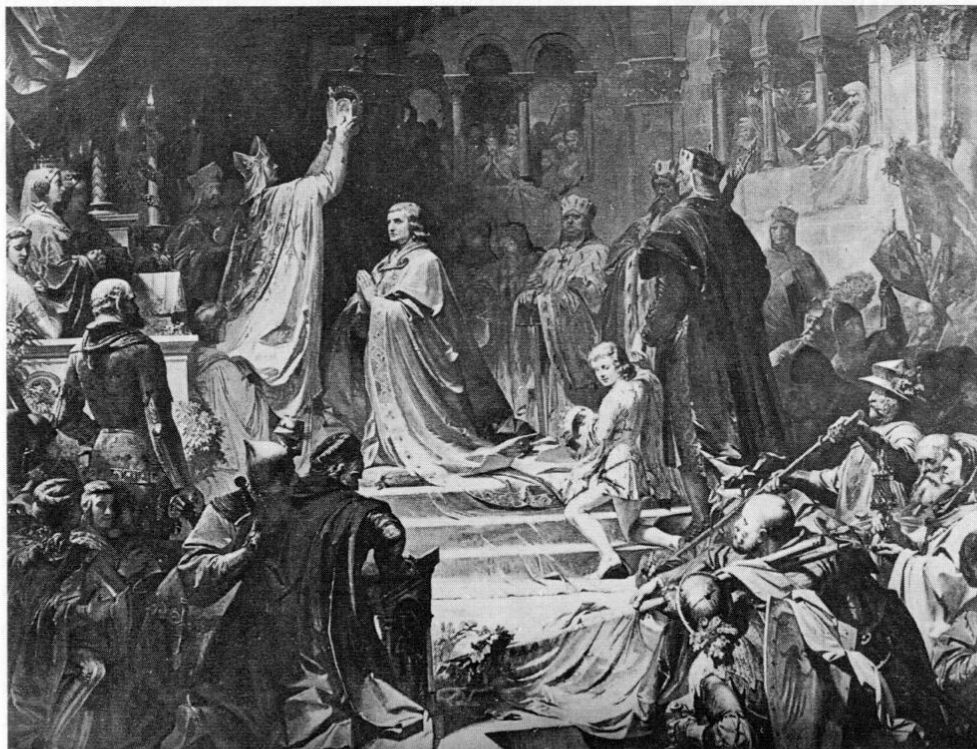
Abb. 1: August von Kreling: Kaiserkrönung Ludwigs des Bayern 1328, Gemälde im Steinernen Saal des Maximilianeums in München.

Zur Idee der »Historischen Gallerie« 2 äußerte schon 1850 Wilhelm Doenniges, der zunächst von Maximilian