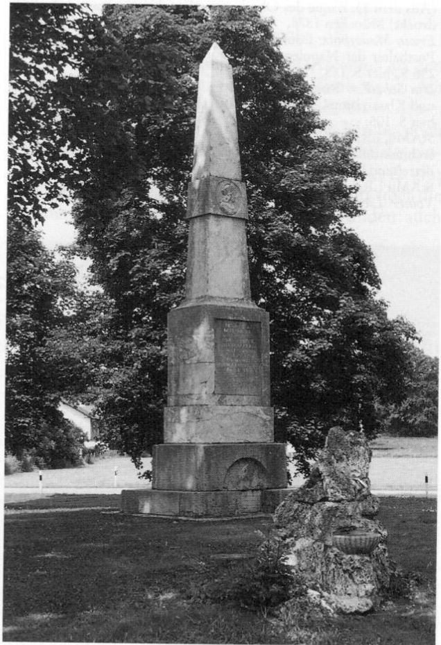
Die Kaisersäule in Puch mit dem Felsen für das Quellwasser nach Restaurierung und Auslichtung der Grünanlage, 1997.