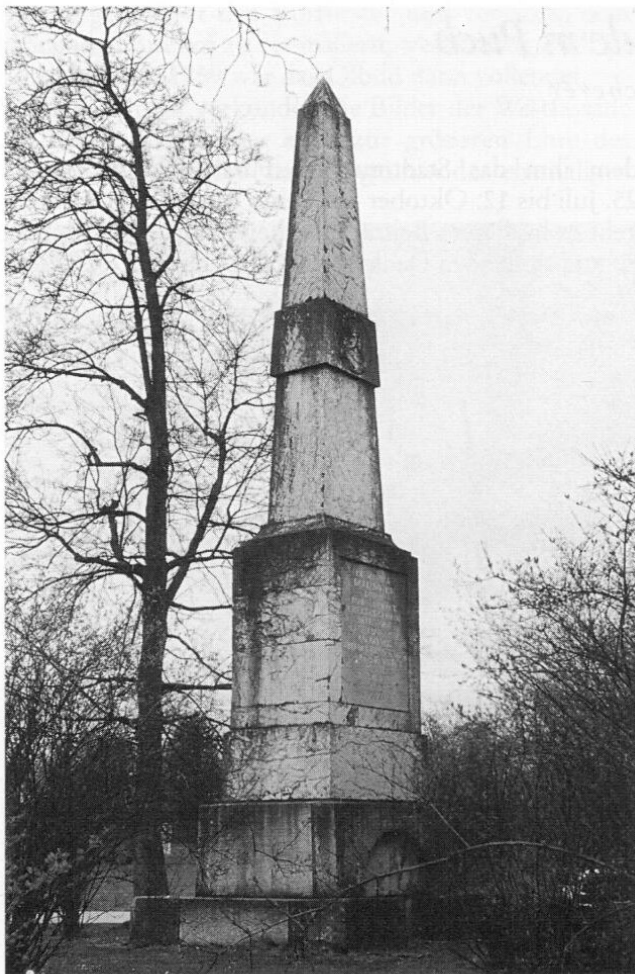
Die Kaisersäule in Puch vor der Restaurierung. Puch wurde 1978 ein Stadtteil von Fürstenfeldbruck.

Im Jahre 1797 hätte das Denkmal auf dem »Kaiseranger« in Puch aufgestellt werden sollen. Durch die