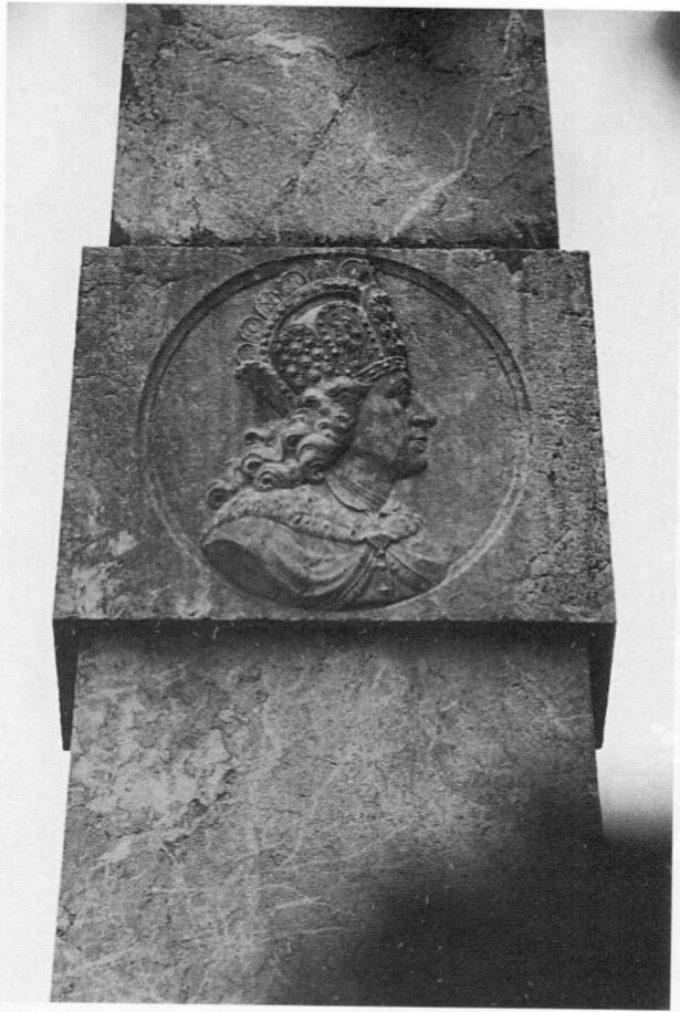
Das Kaiserrelief auf dem historischen Monument in Puch nach der Restaurierung.

(1759–1838) am 8. August 1811 einhundertfünfzig Gulden dazu angewiesen hat. Und 1812 kam er »mit einer hohen Gesellschaft von sieben Personen nach Bruck und besichtigte das Denkmal welches Allen sehr wohl gefiel«. Nach Hartmann war es auch »Herr Posthalter Weiß, welcher nebenbei bemerkt, ein praktischer Kopf gewesen und viel Geschmack besessen haben muß, noch allerlei andere gute Ideen beigetragen hat«. Von Skell wurde beauftragt, das »Arrangement für die nächste Umgebung zu übernehmen, um das Monument würdig zu zieren«. Und »theils zur Verschönerung, theils zur Labung und Erfrischung der vorüberziehenden Wanderer, solle eine Quelle mit reinstem Wasser benutzt werden«. So entstand der (ursprünglich noch höhere) künstliche Felsen mit dem Marmorbecken. Die gesamte Anlage wurde zusätzlich bepflanzt und mit einem Holzgeländer umgeben.