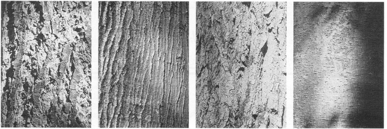
Vier »Amerikaner« im Allacher Forst. Die Rindenbilder zeigen von links nach rechts: Douglasie, Roteiche, Robinie und Weymouthskiefer.