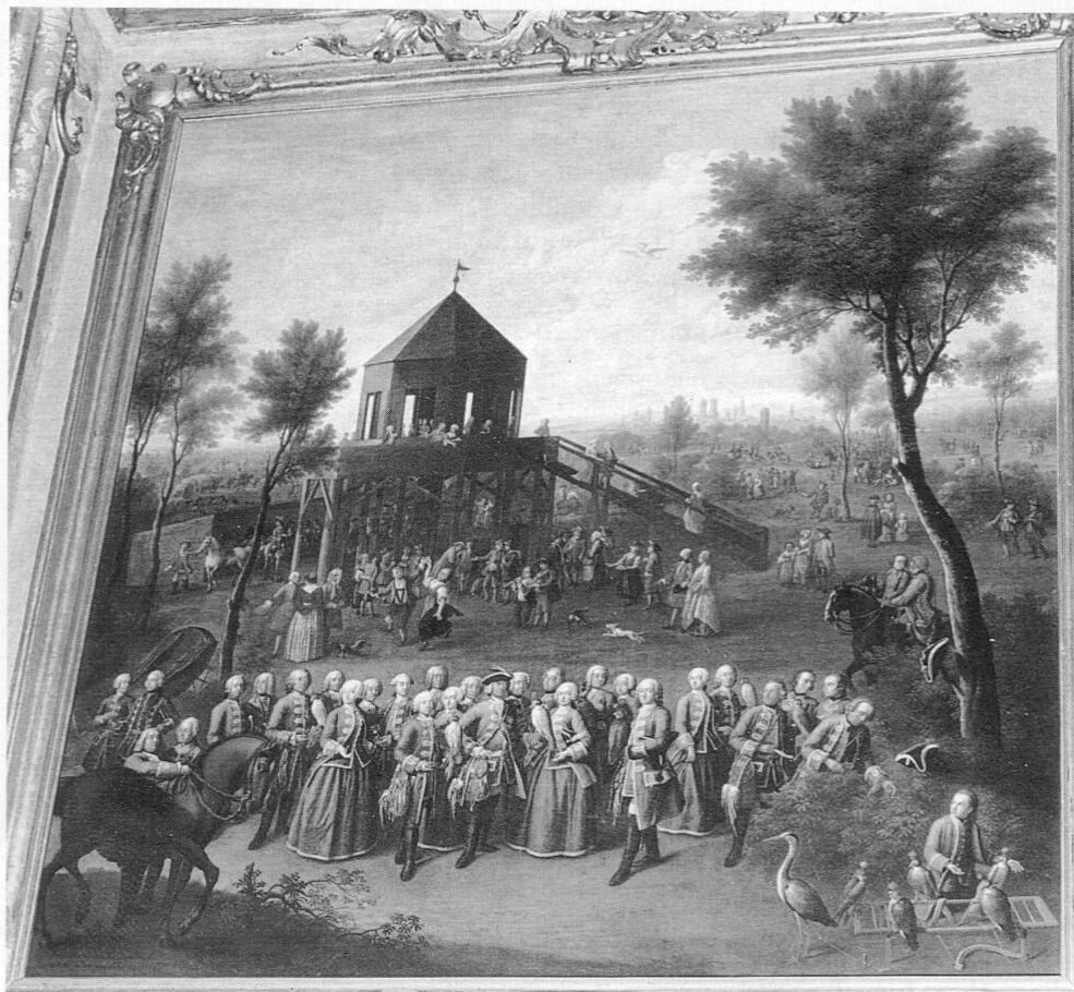
Reiberbeize vor dem Vogelhaus im Allacher Forst – Gemälde von Peter Jakob Horemans im Jagdzimmer der Amalienburg.