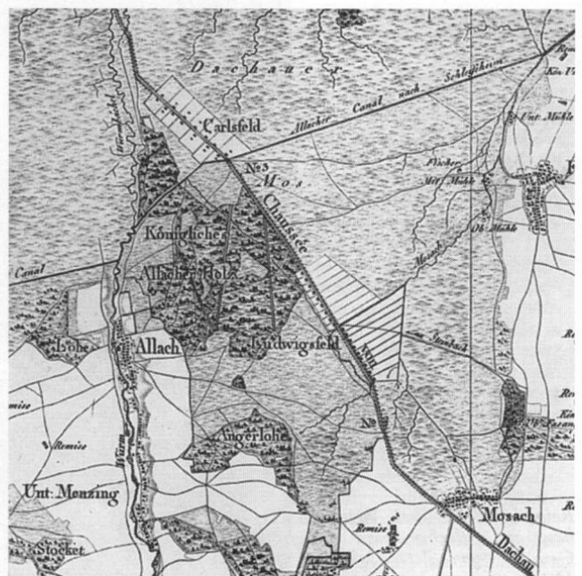
Ausschnitt aus der topographischen Karte von 1812.