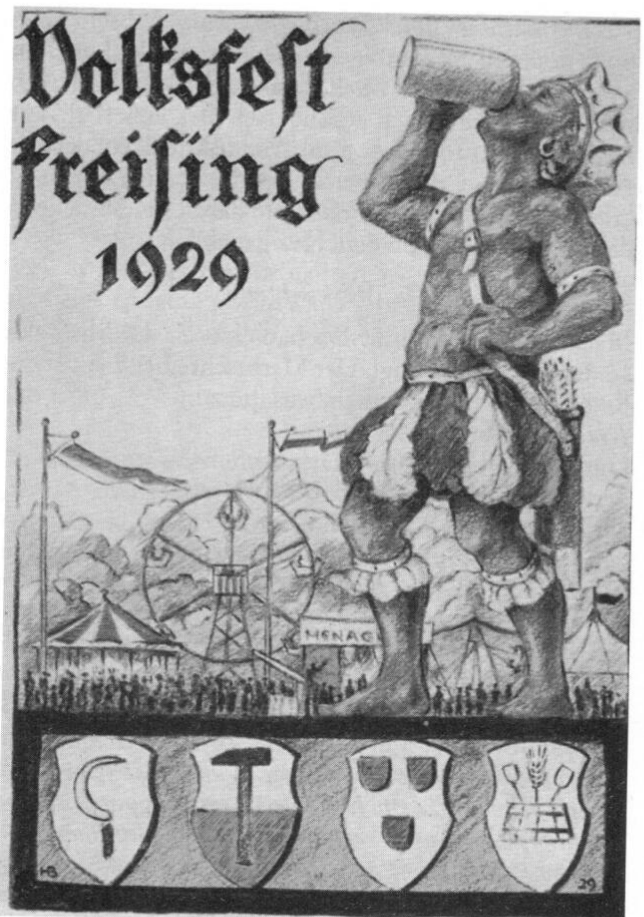
Festpostkarte 1929, Freisinger Mohr, dahinter Volksfest, darunter Schilder mit Symbolen für Landwirtschaft, Gewerbe, Handel und Industrie.