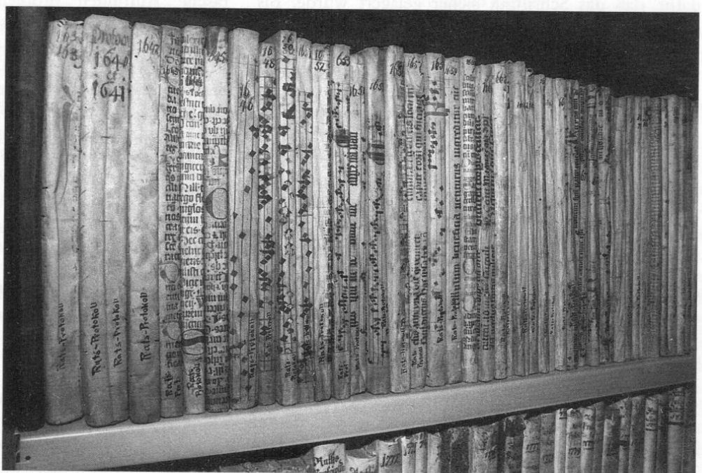
Die ältesten Ratsprotokolle des Marktes Dachau.