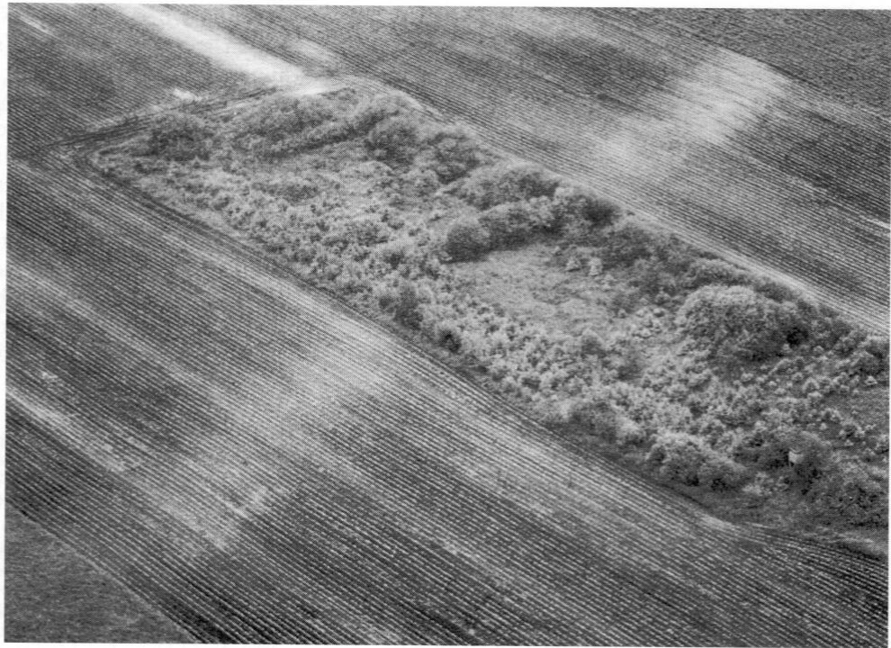
Abb. 13: Luftaufnahme einer römischen Nebenstraße in Richtung der Villa rustica östlich von Erdweg.

bild entdeckte, ca. 500 m lange Straßendamm dar, welcher nördlich der Villa rustica bei Großberghofen in Richtung Eisenhofen verläuft (vergl. Abb. 13 + 14).