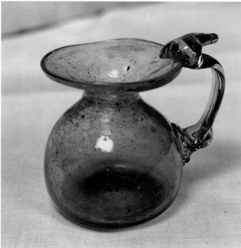
Abb. 7: Römisches Glaskännchen aus der Villa rustica.