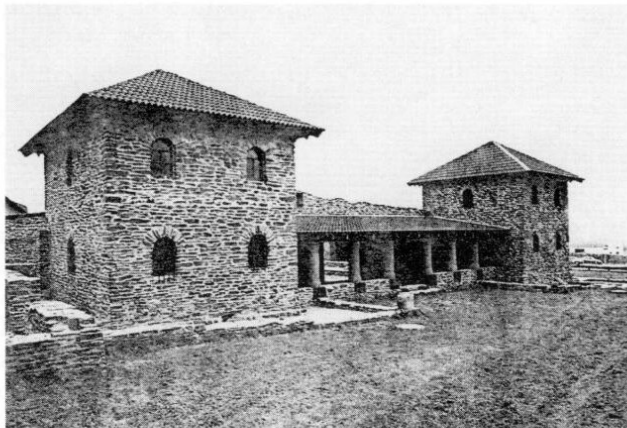
Abb. 15: Rekonstruierte Vorderfront einer Eckerisaltvilla, ehemaliges Hauptgebäude eines großen römischen Landguts bei Mehring im Landkreis Trier.

Ihm folgte das lauwarme Bad (tepidarium) und das Kaltbad (frigidarium), welches oft mit einem Bassin (piscina), einem brusthohen Sitzbecken, versehen war. Die Umfassungsmauer (maceria) wurde dem Geländeverlauf angepaßt, hatte Zufahrtsöffnungen und Schlupfforten und grenzte das gesamte Hofareal nach außen hin ab.