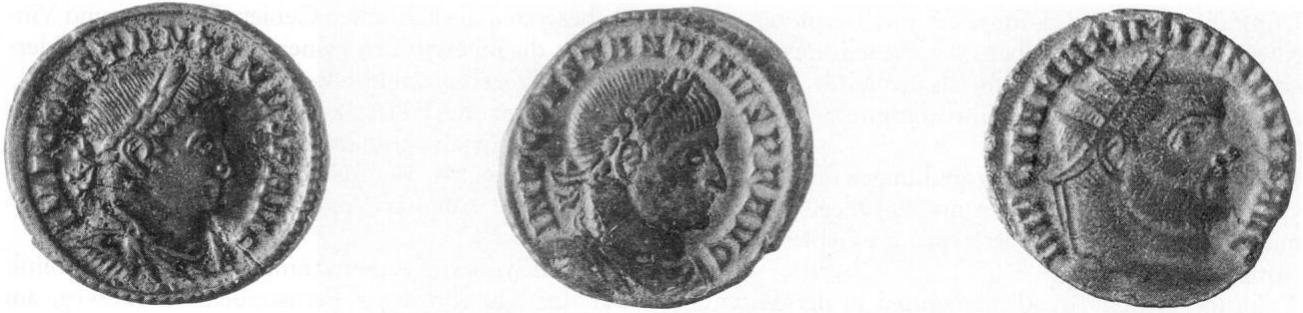
Abb. 8, 9, 10: Münzfunde der Villa rustica: Constantin I. (313 n. Chr.), Constantin I. (316 n. Chr.), Maximianus I. (299 n. Chr.).

Ein bisher noch nicht geklärtes Problem stellt die Wasserversorgung des römischen Gutshofes dar, denn es wurde bis heute noch kein Hofbrunnen ( specus , gemauert puteus ) oder eine Zisterne ( cisterna ) gefunden.