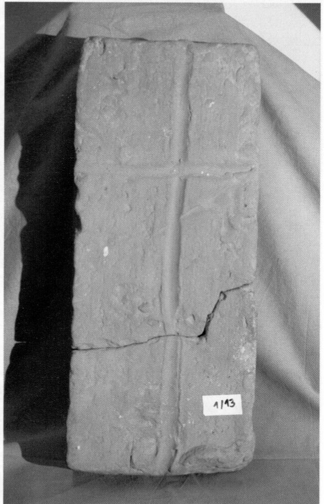
Abb. 11: Römischer Mauerziegel ( testa ) mit Kreuz.

Kaiser Constantin I. führte 313 n. Chr. durch das Toleranzedikt von Mailand das Christentum ein.