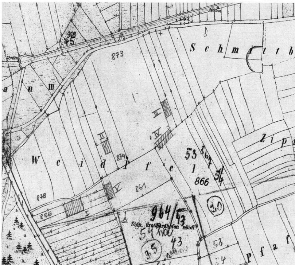
Abb. 3: Flurkarte (um 1910) mit eingetragener Lage der röm. Gebäude entsprechend Lageplan von Simon Hutter.

Überträgt man die Lage der einzelnen Gebäude von der alten Flurkarte in eine topographische Karte (mit Höhenlinien), so erkennt man, daß der einstige römische Gutsbesitzer seine landwirtschaftlichen Gebäude auf einem Hochplateau mit Meereshöhe 493 m angeordnet hat, welches im Nordosten mit einer noch heute bestehenden Grube endet, die vermutlich schon in römischer Zeit als Lehmgrube und späteren Schafpferch benutzt worden ist (vergl. Abb. 5).