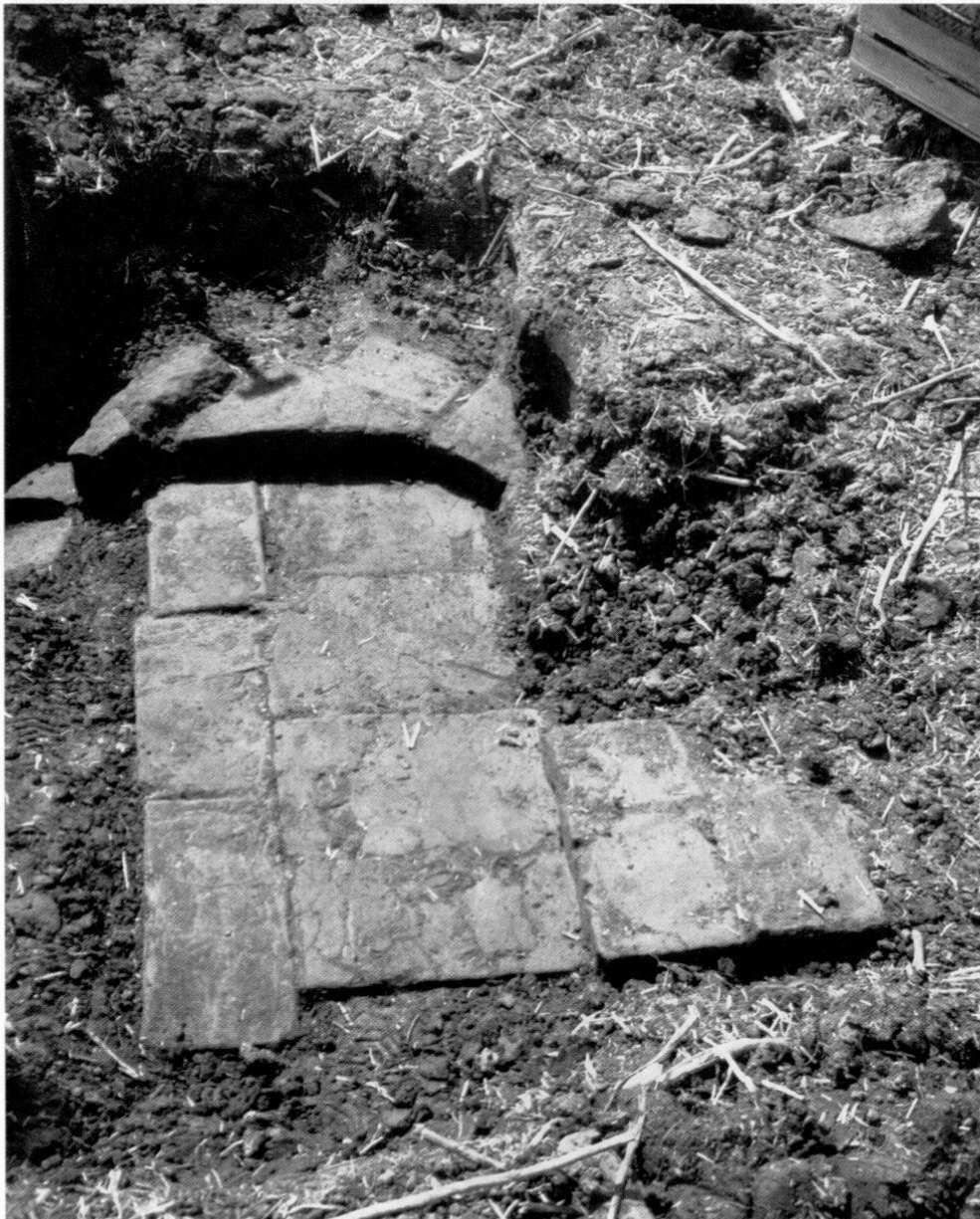
Abb. 12: Römischer Ziegelplattenweg mit Trittstufe.

Eine evtl. Querverbindung zur römischen Fernstraße Augsburg-Freising stellt möglicherweise der im Luft-