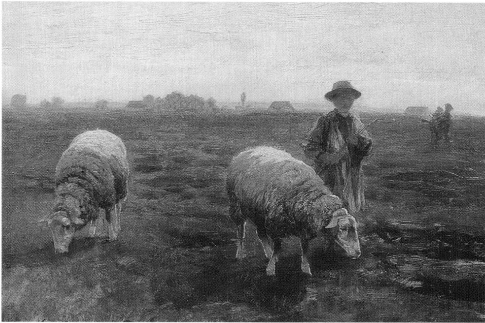
Heinrich Zügel, Hütejunge [Hüterbub] mit zwei weiden Schafen bei Dachau (Öl auf Leinwand, 1887), Privatbesitz.