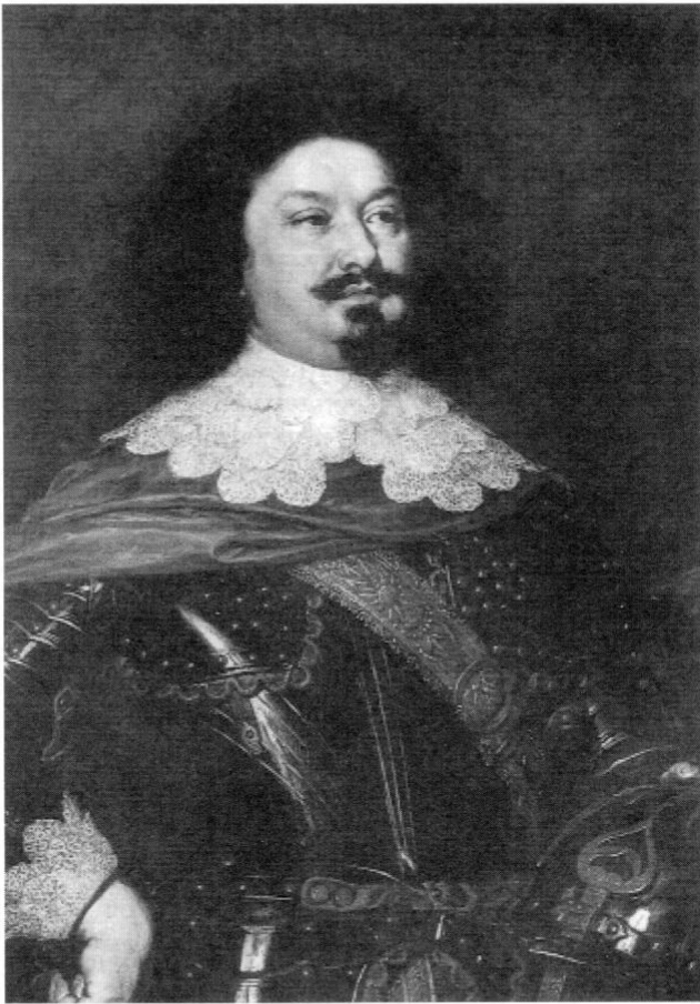
Der kaiserliche Feldherr Octavio Piccolomini, gemalt von Justus Sustermans.