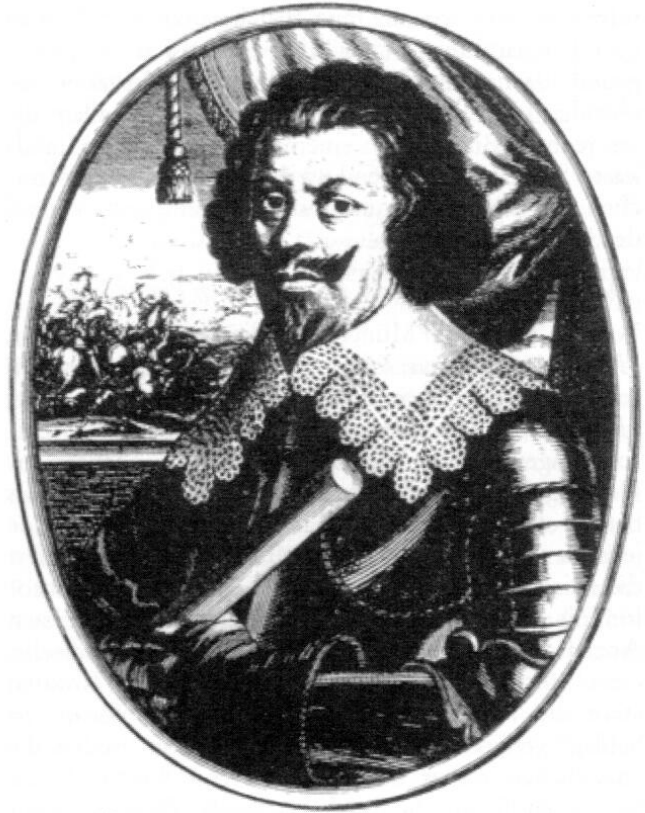
Der Reitergeneral Johann von Werth, Stich von B. Moncornet.