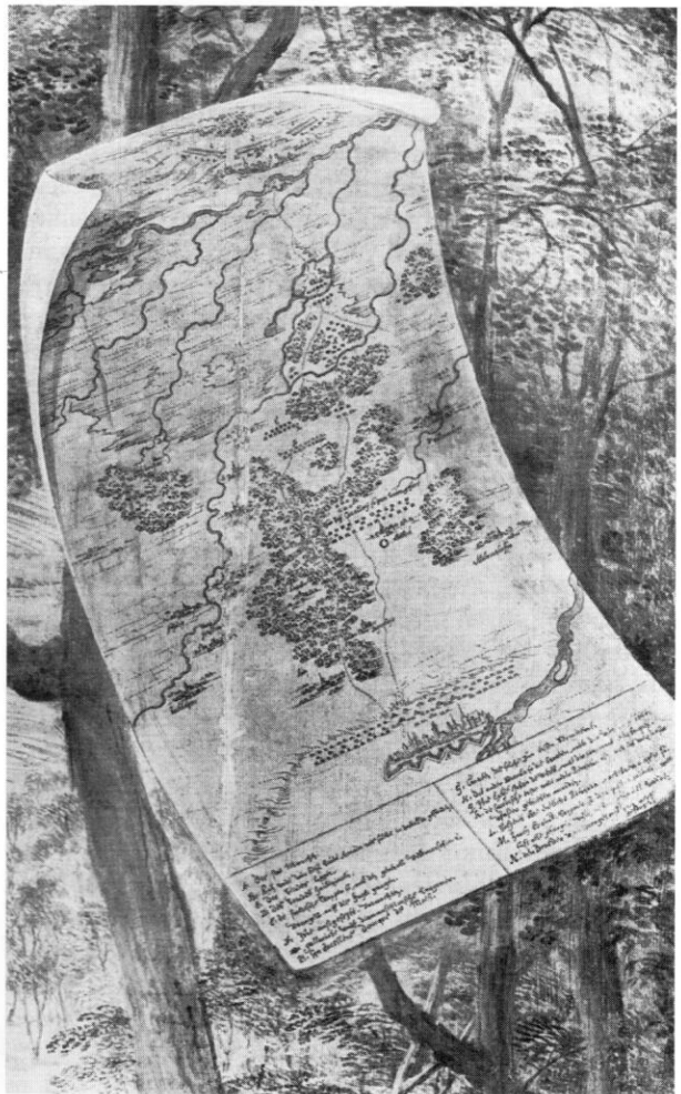
Ausschnitt aus dem Gemälde Pieter Snayers.