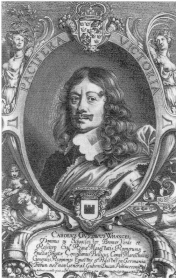
Der schwedische Oberbefehlshaber Karl Gustav Wrangel.

Rücken anzugreifen, war es um deren Stellung geschehen. Wrangels Leibregiment wurde ob seiner Standhaftigkeit »ziemlich geputzt« 36 Die schwedischen Dragoner wurden von ihren Pferden abgeschnitten, eingekreist und aufgerieben oder gefangengenommen. Ihr zäher Widerstand dürfte es aber vielen Schweden ermöglicht haben, sich über die Brücke bei der Rothschwaige nach Dachau zurückzuziehen.