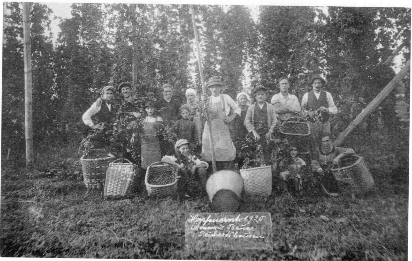
Eine »Hopfenzupfermannschaft« um 1920.

Die Gemeinde Attenkirchen nahm sich des Anliegens der Bauern an, trug die Bitte dem Innenministerium vor und übertrieb in der Begründung mächtig. Von gefährlichem Gesindel, stellenlosen Gesellen und Individuen ist die Rede und auch von einer besonderen »Sorte von Menschen«, die aus allen Gegenden und Herrenländern alle Jahre zum Hopfenpflücken kamen. An dieser Stelle muß der Objektivität halber gesagt werden, dass zu dieser Zeit der weit überwiegende Teil der Hopfenpflücker