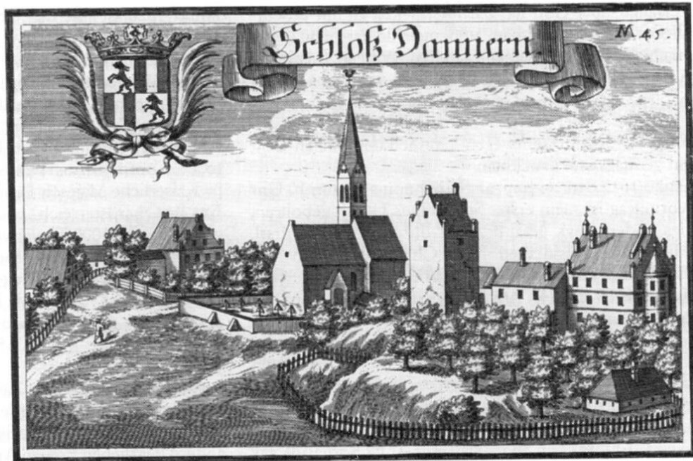
Schloss Tandern um 1700, Kupferstich von Michael Wening. Zu sehen ist auch das Wappen der Freiherren von Mändl.

Cost gedinget, alda ich die humaniora Studia zu Endt gebracht. Bey solcher Rais hat der liebe Gott mich miraculose beym Leben erhalten; dan ich war ein Knab von 10 Jahren, in harten Winter mit Bölz und fuetter [3] eingemacht, auf einen Wagen gelegt, darauf auch ein Fass mit Wein lag, und als wir morgens vor Tag zwischen Mamendorf und Bruck in der finsternen Nacht fahreten, und mein lieber Vatter zu fuess hernach gieng, hat mich der schlaff übergangen, indem ich von Wagen unter die Räder gefallen, also das mir das hintere Rad am Herzen gestanden, welches der Vatter durch ein wunderbahrliches Liecht gesehen, und dem Fuhrmann zu halten geschrien, der in continenti still gehalten, und gesehen, das der Wagen an Leib gestanden, und da er nur ein Schritt gefahren, so were ich vom Wagen vertruckt worden.