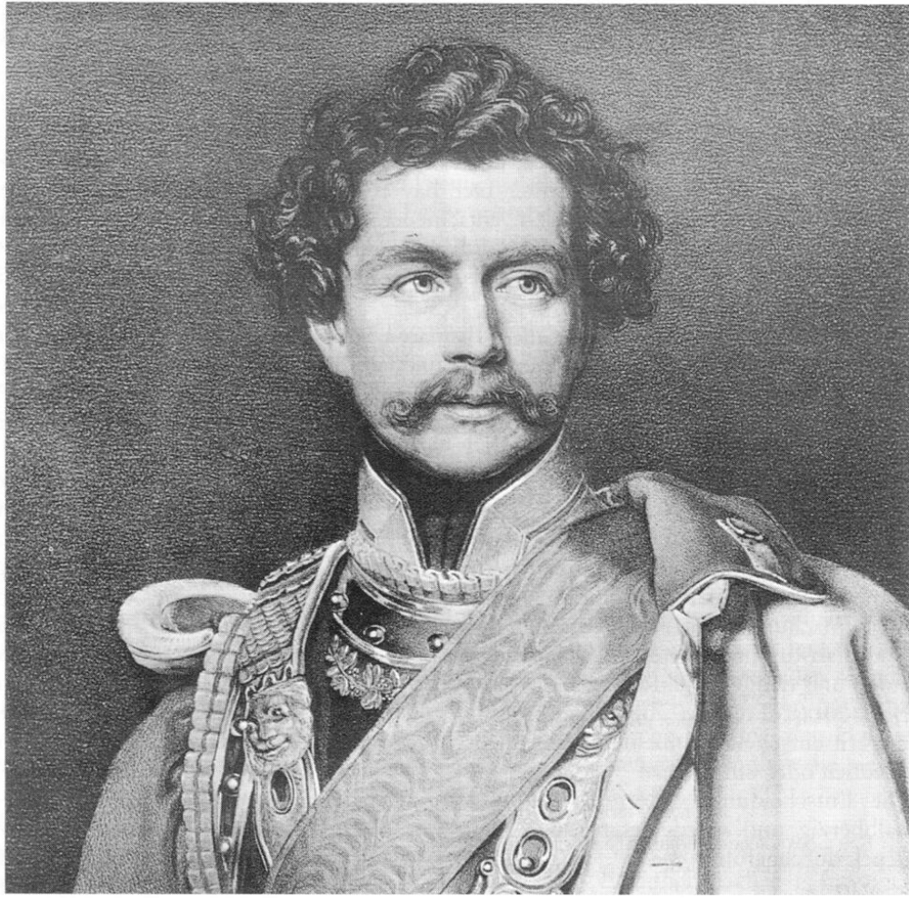
Prinz Carl von Bayern in reifen Mannesjahren.