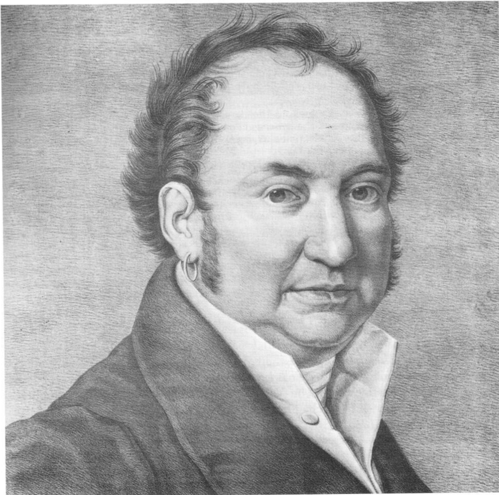
Der Vater, Kurfürst Max IV. Joseph bzw. König Max I. Joseph von Bayern, regierte Bayern von 1799 bis 1825 mit seinem Minister Maximilian von Montgelas. 1802 benannte er eine Mooskolonie zwischen München und Dachau nach seinem Sohn Carl als Karlsfeld.