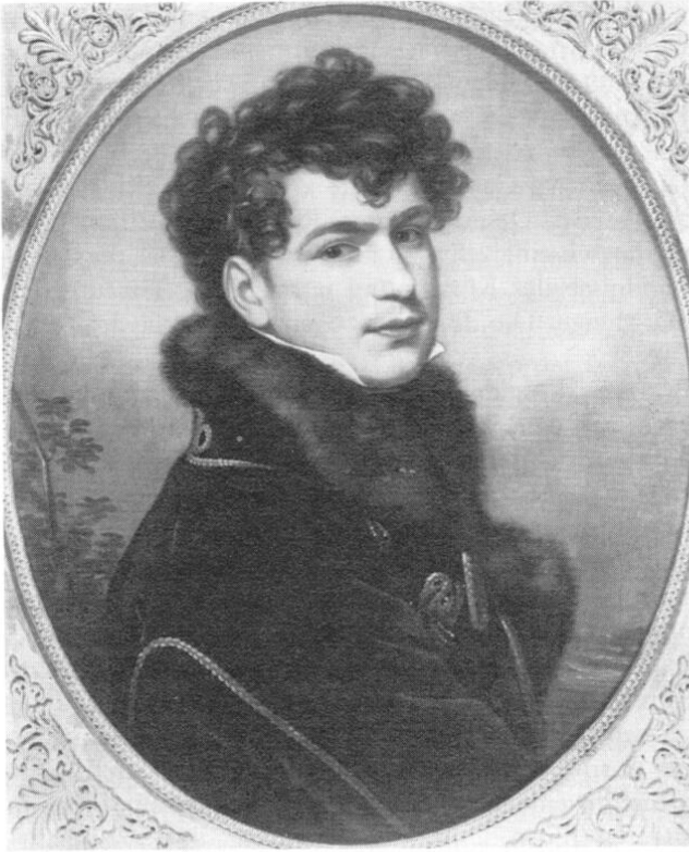
Der 21-jährige Prinz Carl Theodor Maximilian August von Bayern, 1816 gemalt von Joseph Stieler, in der Husarenuniform.