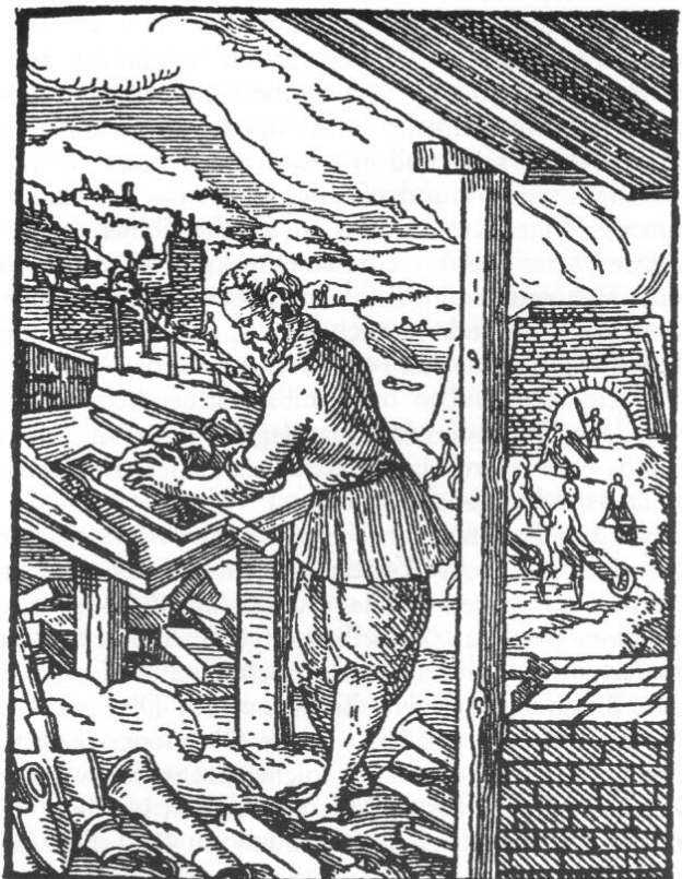
»Der Ziegler« aus dem Ständebuch des Jost Amman, 1568.

den durch diverse Ablagerungen vor ca. 50 Millionen Jahren. Wer die heutige Kulturlandschaft aufmerksam betrachtet, wird in manchen Äckern oder Wiesen Abweichungen vom natürlichen Geländeverlauf feststellen wie Mulden, Böschungen, Weiher oder ähnliches. Hier handelt es sich sehr oft um ehemalige Lehm-, Sand-, oder Mergelgruben, aus denen seit Jahrhunderten Material für den Hausbau, für Straßen und die Verbesserung der Feldböden abgebaut wurde.