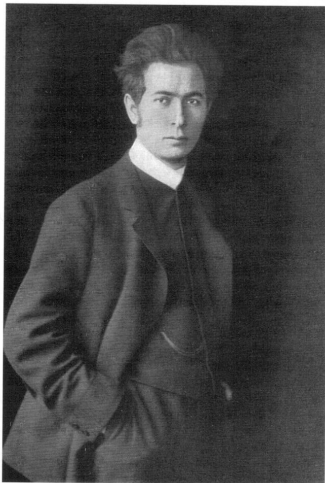
Der Student Theodor Heuss 1905.

Dachau hinterließ bei Heuss einen nachhaltig guten Eindruck, den er auch nach 1945 nicht verdrängte. Wie schon 1894 bei Ludwig Thoma, den Heuss übrigens neben Frank Wedekind gerne las, war es ein Ausflug, der den Reiz der kleinstädtischen Siedlung entdecken ließ. Mit einem »Koffer voll Papier« ließ sich der Student auf dem Schlossberg nieder, um seine Dissertation zu vollenden. Heuss lobt in seinen Jugenderinnerungen die Frühlingsstimmung im Schlossgarten und im Moos, eine Stimmung, die auch die Maler einfingen. Er erinnerte sich der Tanzabende mit den Beamentöchtern, unter anderen mit den Töchtern seines Vermieters, des Schlossverwalters, im Schlosssaal. Die Abende waren »von einer empfindsamen Grandezza« und keineswegs »krachledern-oberbayerisch«. 6 Für das weibliche Geschlecht, für die Dachauerin also, hatte er durchaus einen Blick, wie die Formulierung »es gab in der Familie (des Vermieters) und bei den Nachbarn noch andere Töchter« unschwer erkennen lässt. Am nachhaltigsten beeindruckten ihn aber im milden Blick des Alters die