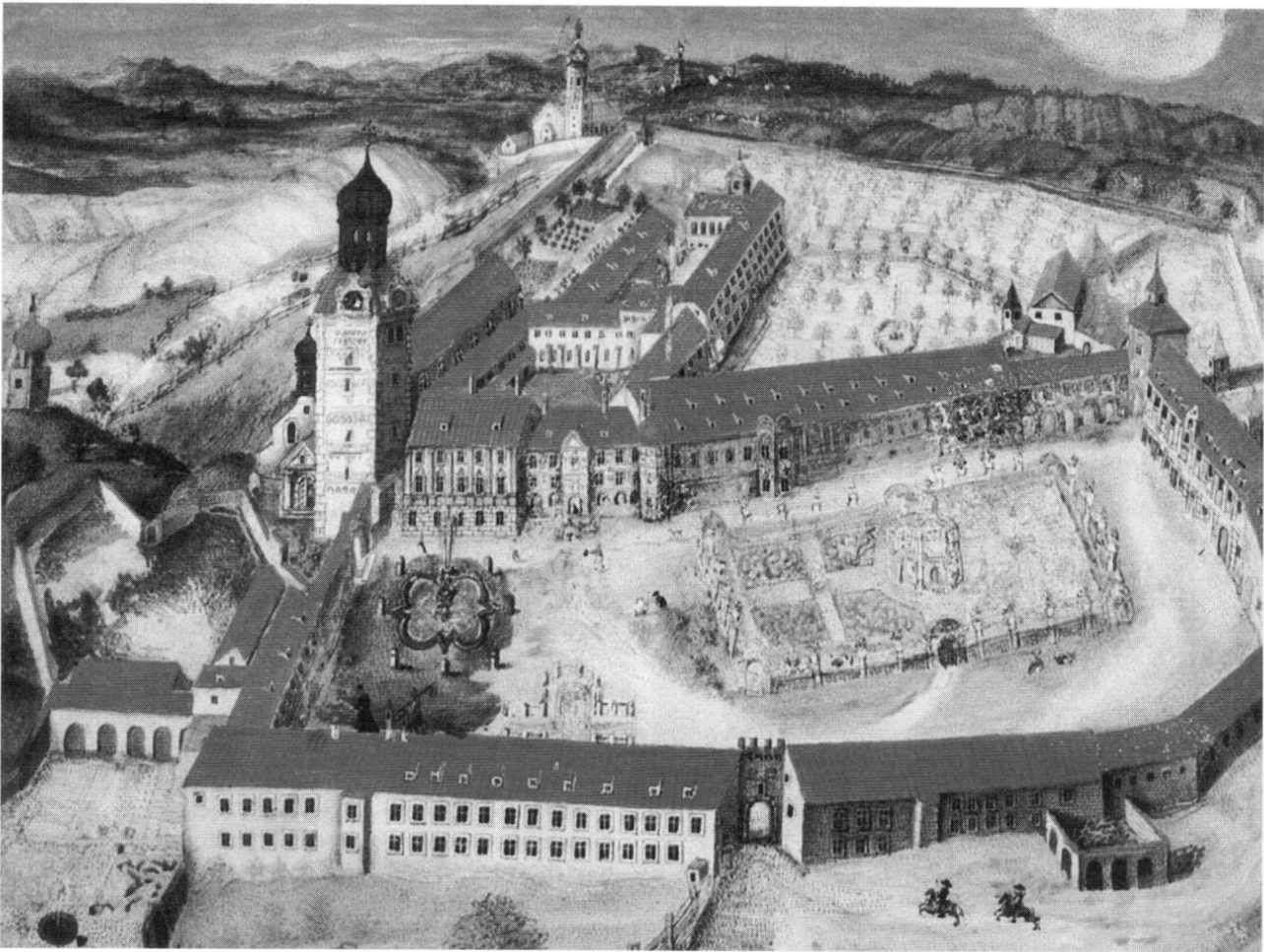
Ansicht der Scheyerer Klosteranlage um 1730. Einige Gebäude und die Pfarrkirche im Hintergrund wurden Opfer der Säkularisation. Die übrige Anlage ist bis heute erhalten.