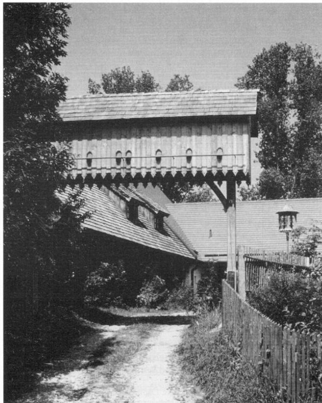
Das Anwesen Kammermeier in Ebersbach.

Einziger Vertreter der Familie der Doldenblütler in unserem