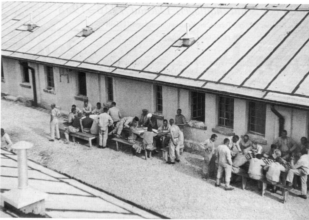
Blick auf eine Häftlingsunterkunft im alten Schutzhaftlager, das mit dem Umzug der Häftlinge ins neue Lager abgebrochen wurde.