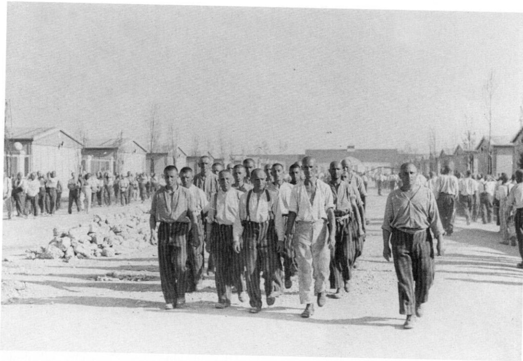
Ein Arbeitskommando auf der Lagerstraße im neuen Schutzhaftlager. Neben der Kolonne geht der Capo, der für das Kommando verantwortlich ist.

den Mahlzeiten einnahmen, mussten sich die Männer selbst einteilen. Ihre Brotration empfangen sie regelmäßig im Voraus und nicht erst zu den Essenszeiten. Die Zuteilung, die täglich auf 500 Gramm begrenzt war, hatten sie allein zu verwalten. Unabhängig davon erhielten die Häftlinge, die im Arbeitseinsatz standen, zusätzlich am Vormittag als so genannte Brotzeit eine Scheibe Brot und Tee, die in einer kurzen Ruhepause eingenommen wurden. Allerdings stand die Zulage nur Facharbeitern, wie beispielsweise Gefangenen in den SS-Wirtschaftsbetrieben, und Capos zu. 78 Die übrigen Häftlinge von dieser Vergünstigung ausgeschlossen. Die Sonderration, die ursprünglich alle Gefangenen zum Frühstück am Arbeitsplatz empfangen hatten, blieb nun selbst für die körperlich hart schuftenden Männer gestrichen, die keine Facharbeit verrichteten. Die Juden waren bei der Zuteilung der Brotzeit schon immer benachteiligt worden: Mal bekamen sie überhaupt kein Stück Brot und mussten statt dessen mit ansehen, wie ihre arischen Mithäftlinge die ersehnte Zuteilung in Empfang nahmen, und mal erhielten sie doch eine Scheibe Brot zugesprochen, die ihnen aber dann wieder zur Strafe entzogen wurde. 79