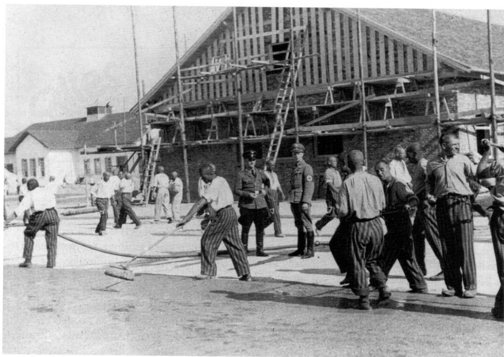
Die Aufnahme zeigt den Westflügel des Wirtschaftsgebäudes im neuen Schutzhaftlager kurz vor seiner Fertigstellung. Heute befindet sich dort der Eingang zum Museum der KZ-Gedenkstätte.