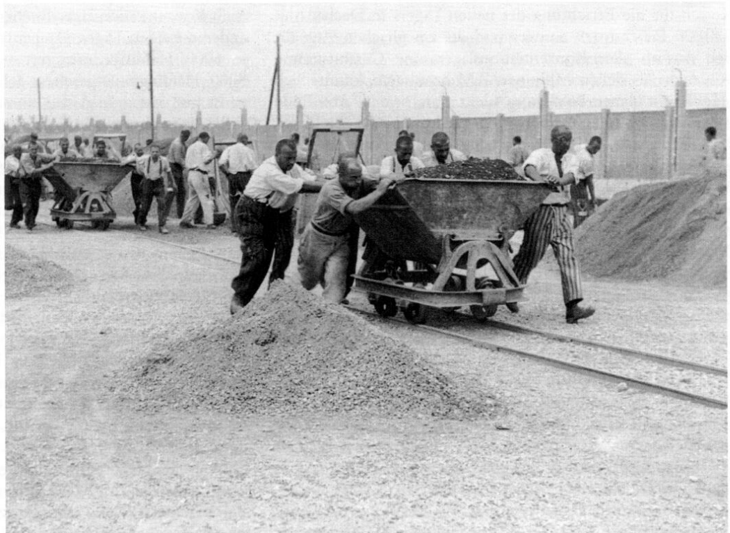
Einsatz von Dachauer Häftlingen an den Loren einer Feldbahn im mörderischen Arbeitstempo.

Neben dem mörderischen Arbeitstempo, das von den Isolierten der Strafkompagnie – sie lebten von den übrigen Häftlingen streng getrennt – verlangt wurde, blieben den Angehörigen der SK auch Misshandlungen nicht erspart. Entlang der Schienen standen junge SS-Posten mit umgehängten Gewehren, die in der Hand eine dünne, nasse Wurzel hielten. »Auf geht's – Tempo!« schrien sie. »Und die Wurzeln«, erinnert sich Hübsch, »sausten unaufhörlich durch die Luft und trafen die Rücken der Unglücklichen.« Der Spießrutenlauf endete für die Gefangenen erst am Ziel, wo sie jedoch eine neue Demütigung erwartete. Sobald die Männer der SK am Weiher erschienen, hatten alle anderen Häftlinge, die dort damit beschäftigt waren, die herangefahrene Erde in den See zu schaufeln, unverzüglich zurückzutreten. Es war ihnen verboten, Fühlung mit den Unberührbaren aufzunehmen. So rollten die Loren, geschoben von mehreren Gefangenen, schnell heran. Rasch wurden die Kübel der Wagen mit der Ladung umgekippt und entleert, und schon eilten die Gehetzten mit den Loren wieder davon. Die Posten, die sie antrieben, ließen ihnen keine Pause. »Auf geht's – zurück. Tempo! Tempo!« brüllten sie drohend. Und von neuem begann der Spießrutenlauf über die Distanz von tausend Metern – aber nun in entgegengesetzter Richtung.