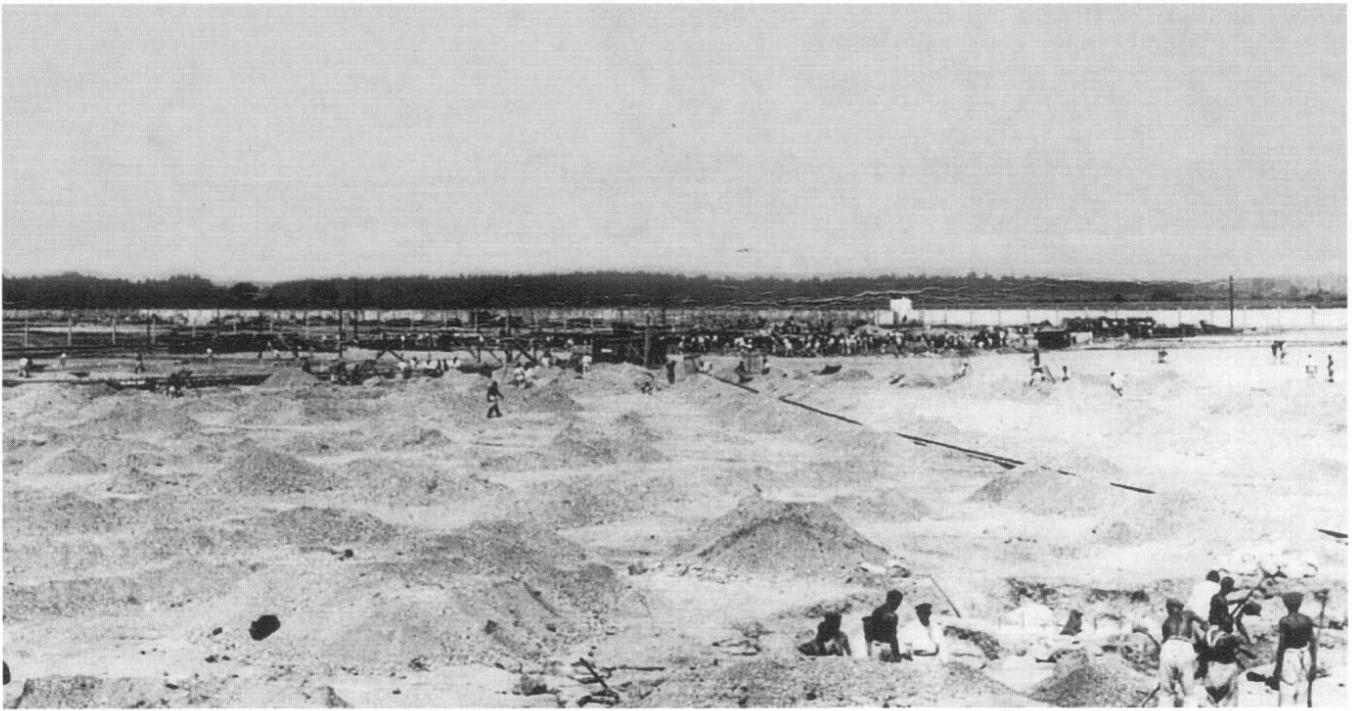
Das riesige Baugelände, auf dem das neue Schutzhaftlager entstand. Dem Bauvorhaben musste der Fichtenwald, der dort stand, weichen.