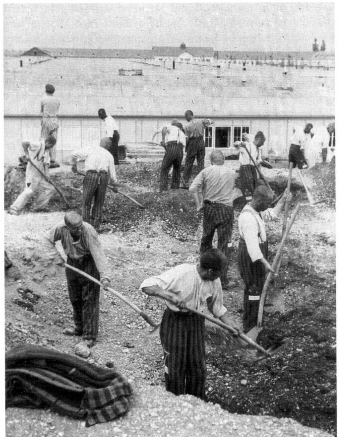
Der oberste Grundsatz im Arbeitseinsatz lautete für alle Häftlinge. »Mit den Augen arbeiten.« Nur mit äußerster Wachsamkeit konnten sie sich einer Strafe bei den oft überfallartigen Kontrollen der Lager-SS entziehen.

Beim Schaufeln ist lebhaft, taktmäßige Bewegung des Oberkörpers und der Arme notwendig, da ein Stillhalten noch auf sehr große Entfernung deutlich erkennbar ist; aber wenn sich kein Aufsichtsorgan in unmittelbarer Nähe befindet, kann man sich viel Mühe sparen, wenn man die Schaufel wenig oder gar nicht belastet. Ich habe manche Viertelstunde mit ganz leerer Schaufel intensiv geschaufelt. Um bei Erdarbeiten