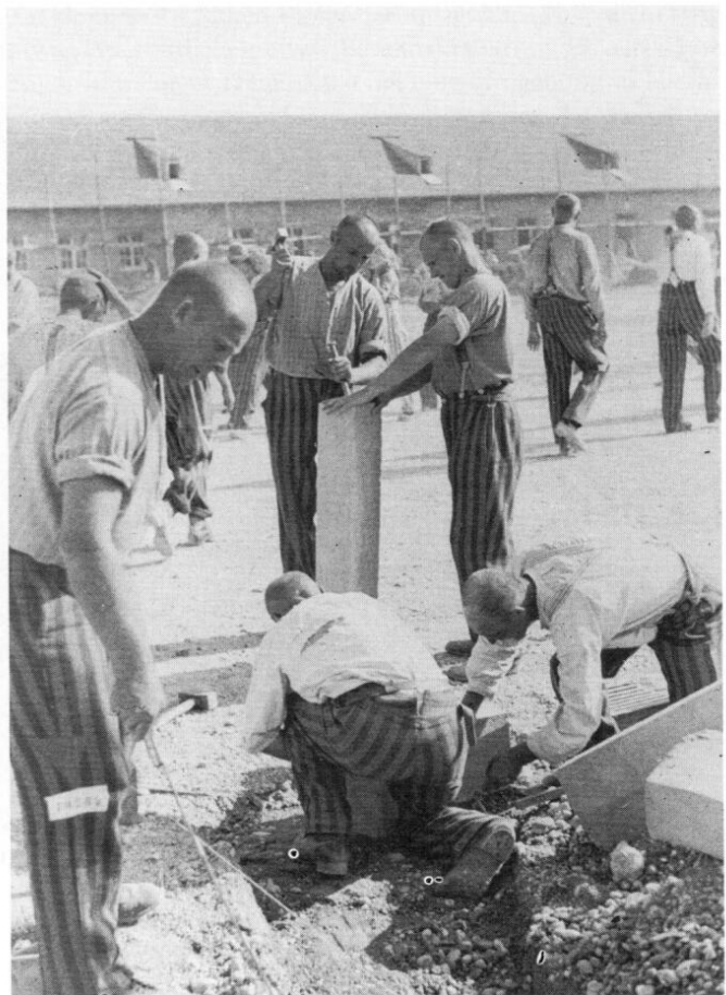
Dachauer Häftlinge bei Fundamentierungsarbeiten im neuen Schutzhaftlager.