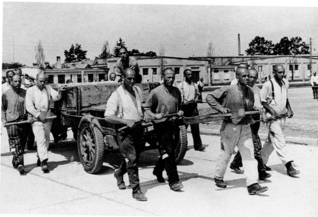
Häftlinge mit einem »Moorexpress«, wie die Transportwagen im KL Dachau genannt wurden, die von Männern der so genannten Transportkommandos gezogen werden mussten.

Mancher mußte infolge Erschöpfung fortgetragen werden. Ein Eimer kaltes Wasser brachte den Erschöpften wieder mühselig auf die Beine.«