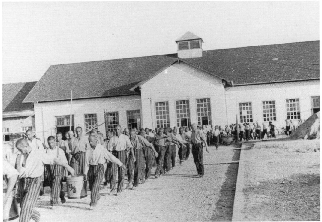
Gefangene beim Transport von Essenkübeln vor der Häftlingsküche, die sich in der Mitte des Wirt- schaftsgebäudes befindet.