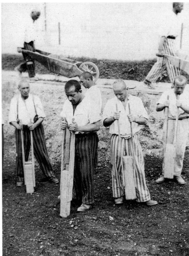
Den Häftlingen steht nur unzureichendes Baugerät zur Verfügung. Die SS versagt den Gefangenen jedes Hilfsmittel, das ihre Arbeit erleichtern könnte.