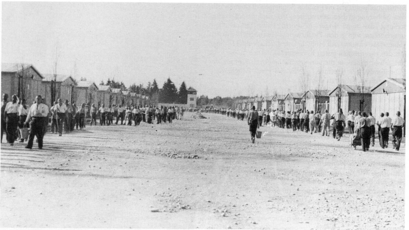
Blick auf die breite Lagerstraße des neuen Schutzhaftlagers, dessen Bau im Jahre 1938 abgeschlossen wird.