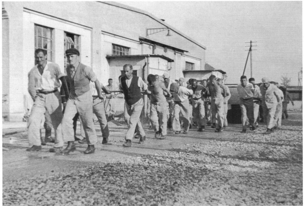
Das Ziehen der Straßenwalze ist für die Häftlinge im Straßenbau mit unbeschreiblichen Strapazen verbunden. Viele sind dieser Schinderei nicht gewachsen und brechen erschöpft zusammen.