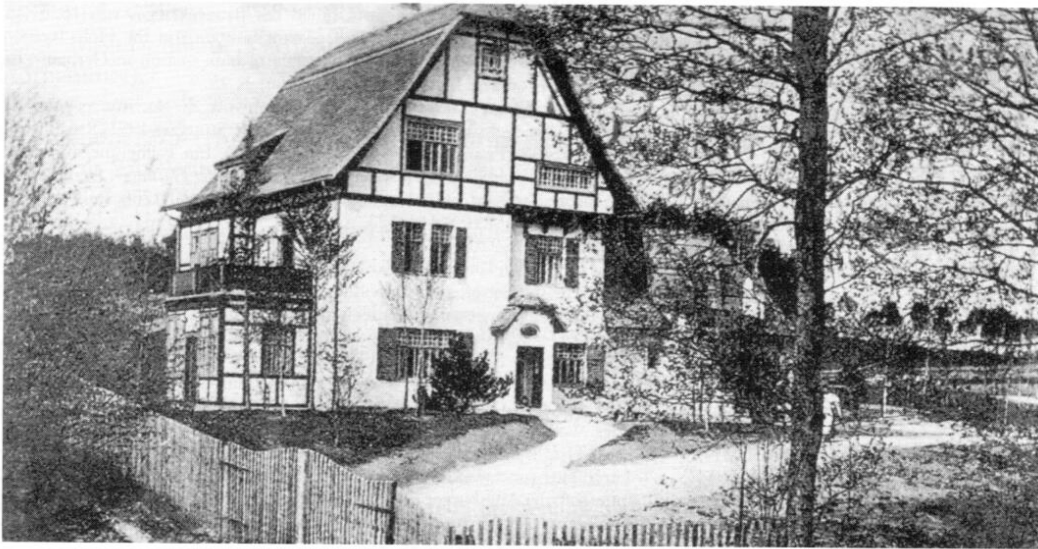
Villa Behrendt in Grafrath.

jungen Mann nicht befriedigt zu haben, er wandte sich der Malerei zu. Er studierte ab 1884 zuerst an der Akademie Königsberg, später in Karlsruhe und Berlin, lebte zwischen- durch einige Zeit als freischaffender Künstler in Hamburg, wo er im Kunstverein ausstellte und seine Einnahmen wie viele Kollegen durch Malunterricht aufbesserte. Ab 1894 schickte Behrendt seine Bilder zu großen Ausstellungen in Berlin, München und Wien. 1901 übersiedelte er nach München, wo er sich der Secession anschloss und an deren Ausstellungen beteiligte. Behrendt begann Farben herzustellen, anfangs nur für sich und einige Kollegen. 3