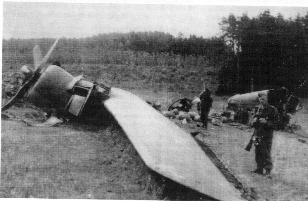
Wrack der abgestürzten Liberator bei Aign.

Kurz bevor der brennende Bomber auf dem Boden aufschlug, war die noch lebende aber teilweise verwundete Besatzung von sieben Mann mit dem Fallschirm abgesprungen. Von diesem Vorkommnis erfuhr als erste amtliche Stelle die Gendarmeriestation in Attenkirchen, 6 von wo aus die Ehefrau des eingerückten Postenführers den mit ihr befreundeten Kreisleiter