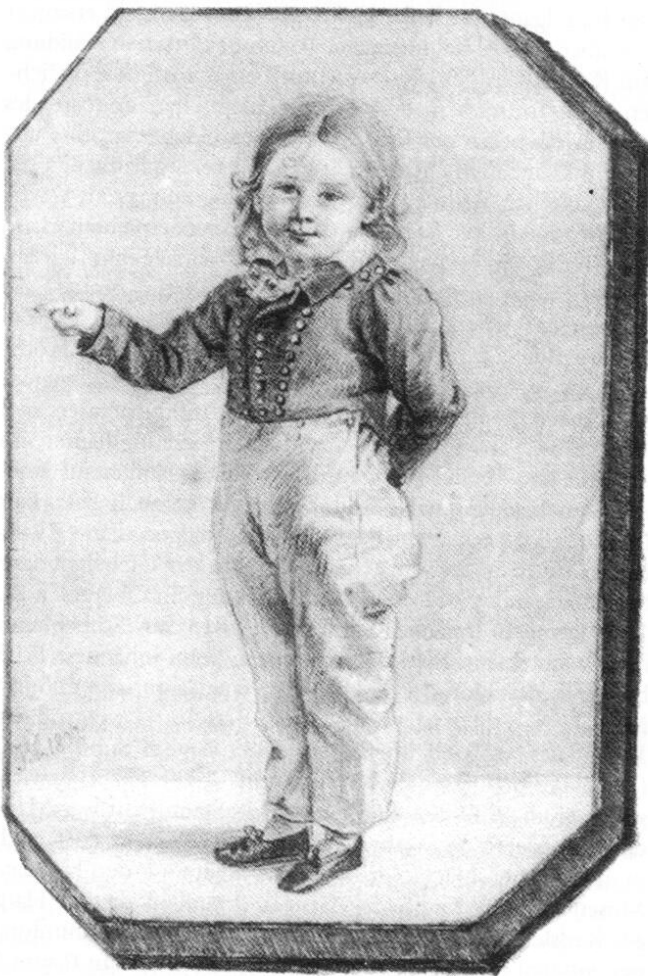
Prinz Karl Theodor von Bayern. Bleistiftzeichnung, aquarelliert von Josef Hauber, 1800.