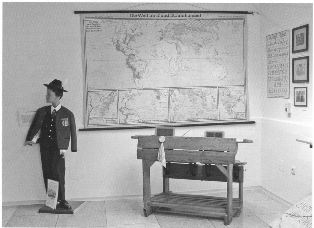
Inszenierung zur gemeinsamen Schulgeschichte von Ludwigsfeld und Karlsfeld.