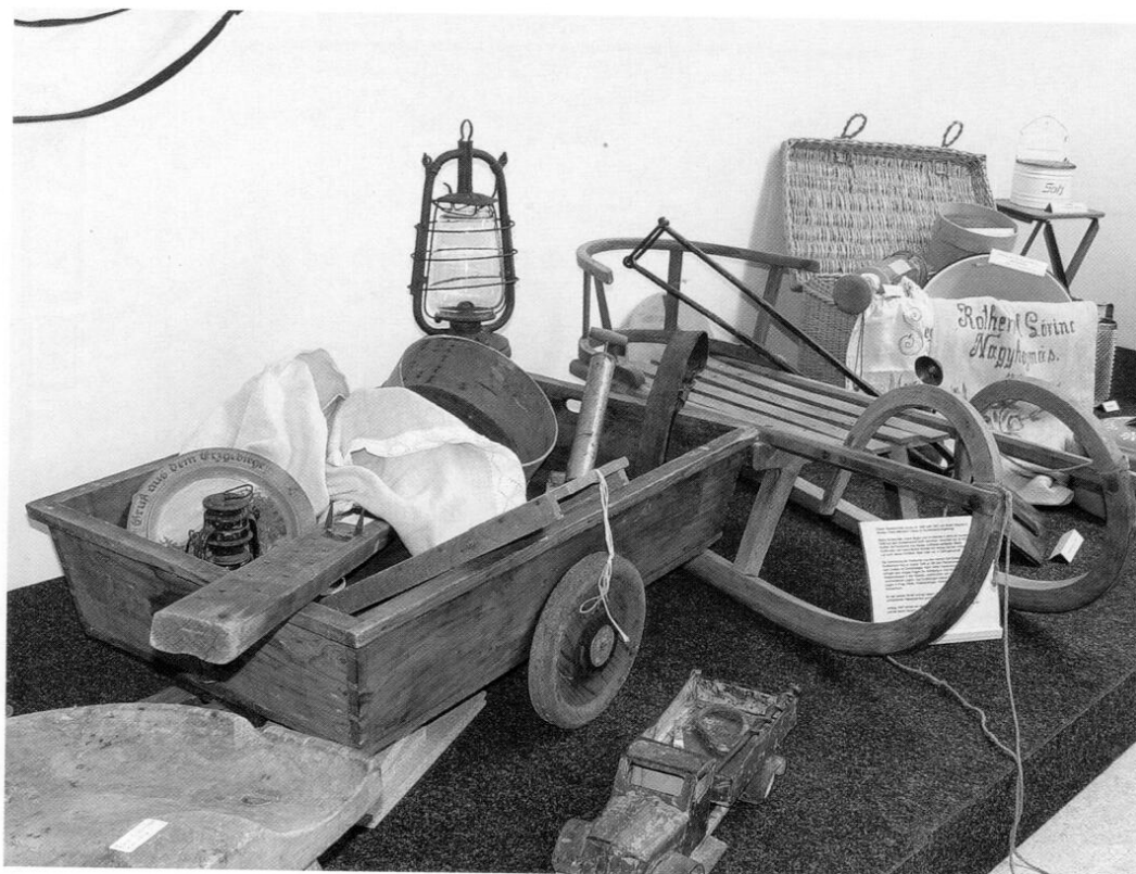
Nach Karlsfeld gerettete Habseligkeiten der Flüchtlinge und Heimatvertriebenen.

sehschrank, Cocktailsessel und Nierentisch hielten auch in den Karlsfelder Wohnstuben Einzug. In einer eigenen Ecke sind alle Utensilien zusammengestellt, die damals zu Bad und Waschküche gehörten. Von der Brennschere bis zum Rasiermesser, vom Waschbrett bis zur ersten Waschmaschine ist alles vertreten. Wieder im Flur angelangt, fällt ein letzter Blick auf ein Modell der TSV-Vereinshütte in Flecken – das einzige