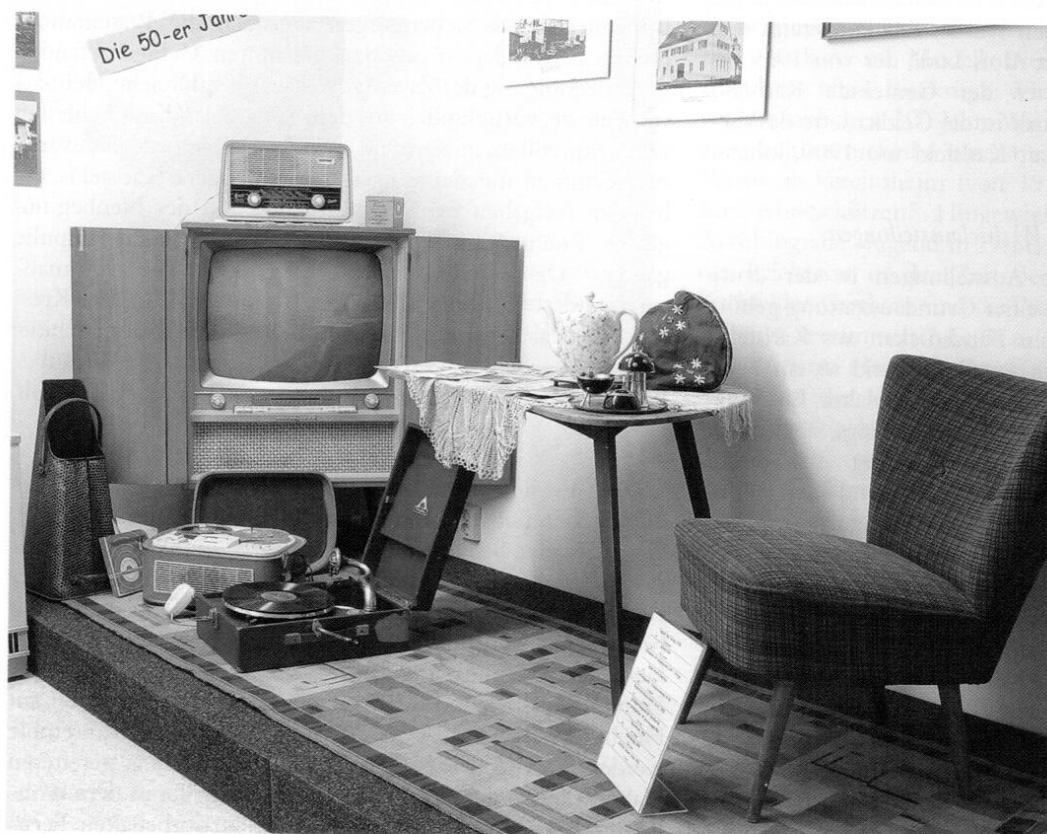
Inszenierung »Die 50-er Jahre«.

von insgesamt 18 Architekturmodellen, das nicht von Engelbert Kroll, sondern von einem Mitglied des TSV Eintracht Karlsfeld stammt. Die Häusermodelle sowie einige Luftbilder ausgenommen, wird die weitere rasante Entwicklung der Gemeinde Karlsfeld in den sechziger und siebziger Jahren nicht mehr vertiefend dargestellt. 14 Über die beschriebenen fünf Räume und die beiden Flure