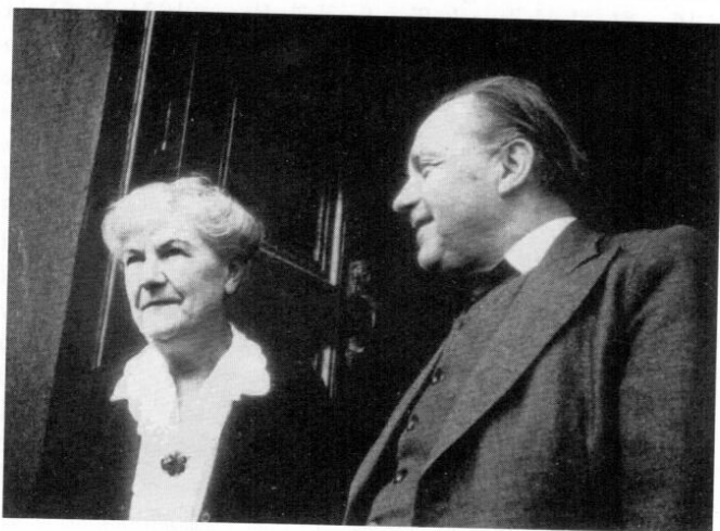
Das letzte Bild von Tilly und Aloys Fleischmann, Cork ca. 1960.

Aloys Fleischmann junior komponierte 50 Werke, 46 von denen alle in Irland, einige auch in England, Deutschland und Amerika aufgeführt wurden. Sein Hauptinteresse als Musikhistoriker bildete die traditionelle irische Musik. 47