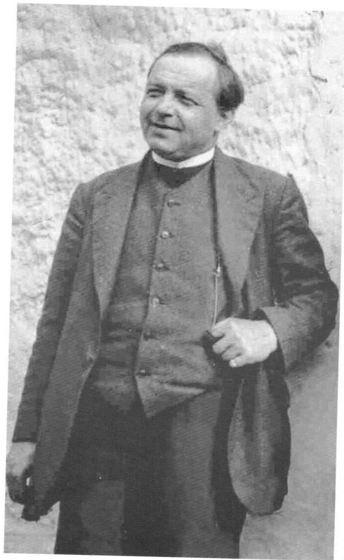
Aloys Fleischmann 1933 in Cork.

1929 fand zum ersten Mal Feis Maitiu statt, 36 ein Festival der traditionellen irischen wie der klassischen europäischen Musik. Als Preisrichter wurde dazu der englische Komponist und zukünftige Master of the Queen's Music Arnold Bax eingeladen. Er erteilte Fleischmanns Cathedral Choir Bestnoten