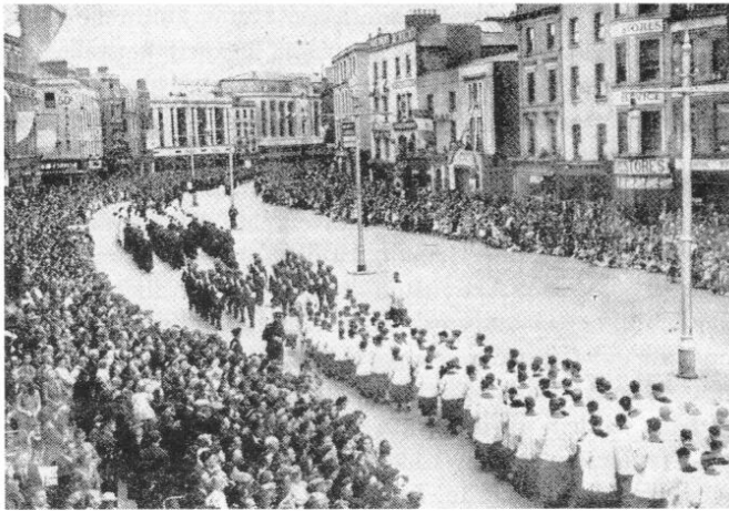
Der Domchor bei der Fronleichnamsprozession durch die Stadt im Juni 1946.