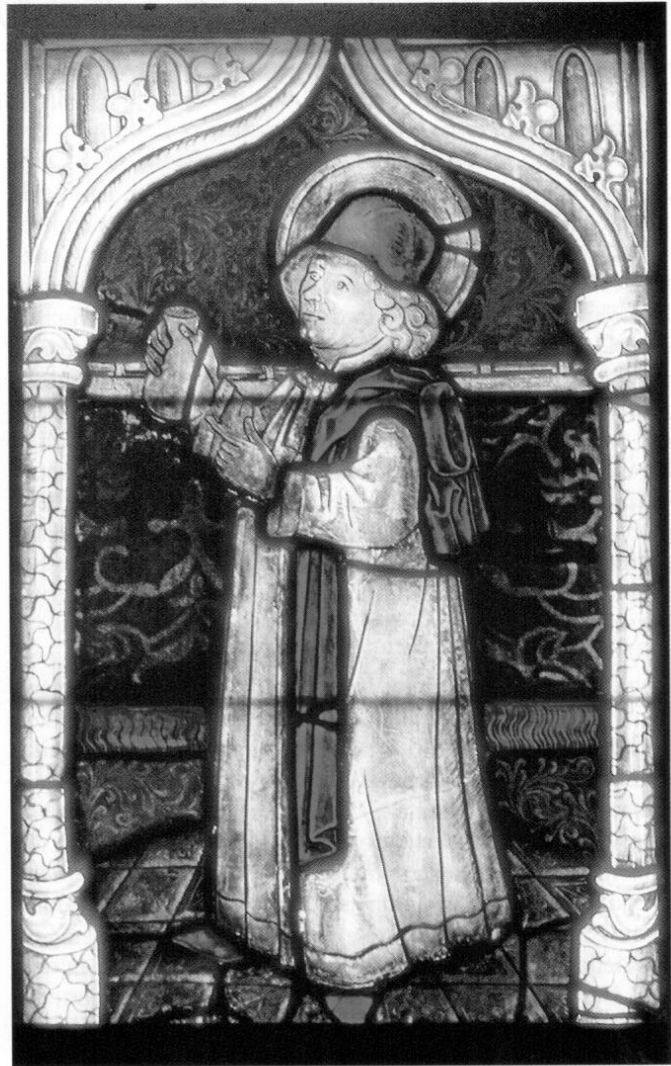
Die Heiligen Kosmas und Damian, Glasmalerei einer Münchner Werkstatt 1479 in der Wolfgangskirche in München-Pipping