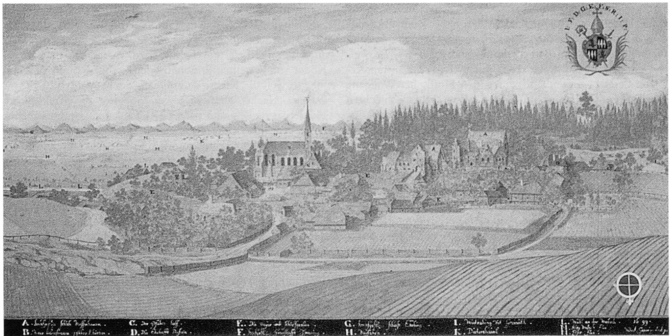
Die Hofmark Massenhausen mit Schloss, Valentin Gappnigg, 1699.