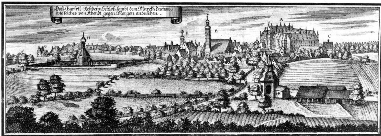
Dachau um 1701 aus Osten gesehen