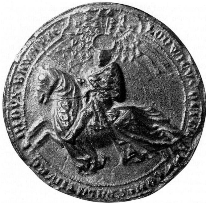
Reitersiegel Herzog Ludwig II. des Strengen (1253–1294), des mutmaßlichen Marktgründers