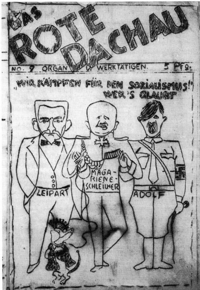
Die letzte Ausgabe der illegal erscheinenden Zeitung der Dachauer Kommunisten, die den Titel »Das Rote Dachau – Organ der Werktätigen« trug.