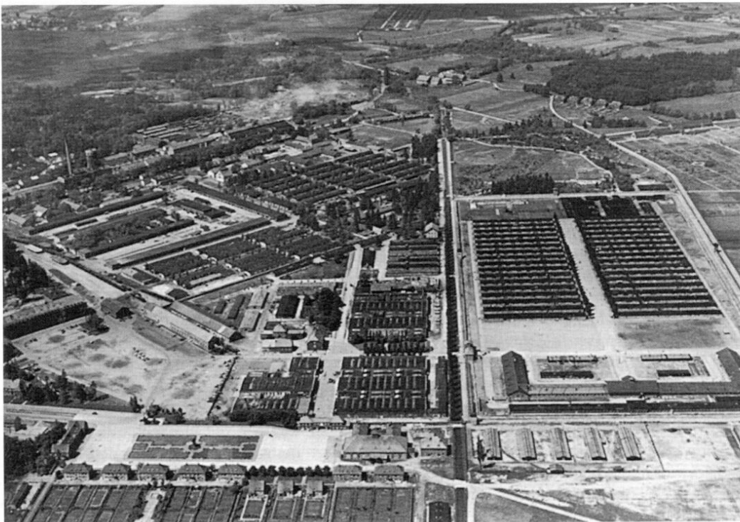
Das Luftbild zeigt links das SS-Lager und rechts das angrenzende Schutzhaftlager. Die Aufnahme der US-Armee entstand am 27. Mai 1945.

Außerdem wurde ebenfalls mit Wirkung vom 1. April 1939 eine kleine Fläche der Nachbargemeinde Hebertshausen in die Stadt Dachau eingegliedert, weil die »Teilflächen von ins-