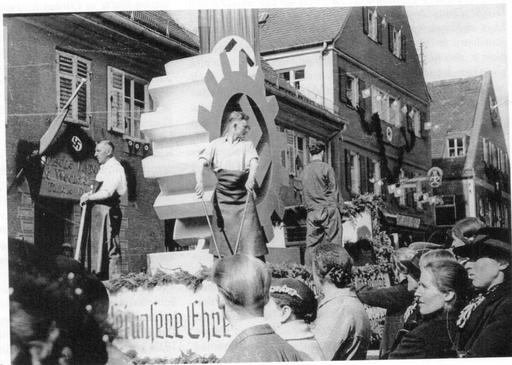
Der Festwagen des Metallhandwerkes in der Augsburgener Straße

»So ist es auch erklärlich«, führte Cramer aus, 12 »daß die Gemeinde in den vergangenen 2 Jahrzehnten gänzlich außer-