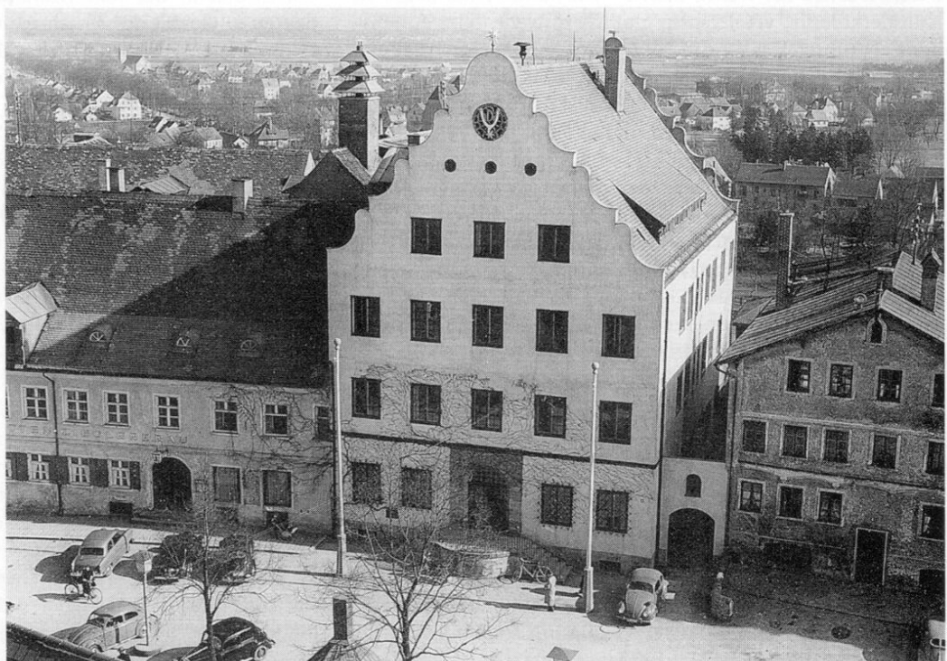
Das Dachauer Rathaus, das in den Jahren von 1934 bis 1936 an der Stelle des gotischen Vorgängerbauwerks errichtet wurde. Das alte Rathaus musste wegen Einsturzgefahr abgebrochen werden.