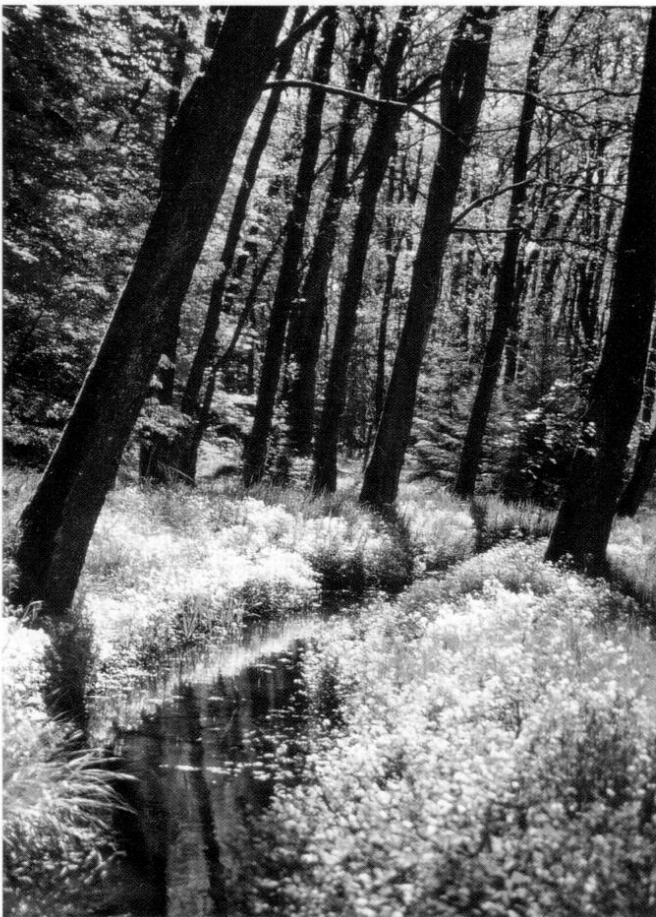
8 Johannisbeer-Erlen-Eschen-Auenwald, Ausprägung mit Bitterem Schaumkraut