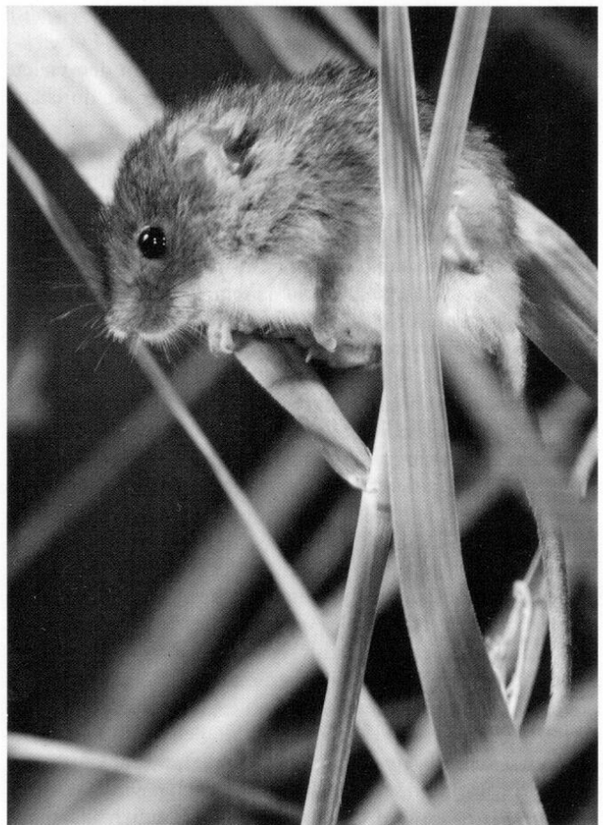
9 Zwergmaus ( Micromys minutus )