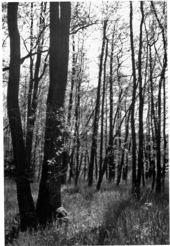
7 Johannisbeer-Erlen-Eschen-Auenwald, Ausprägung mit Rohrglanzgras