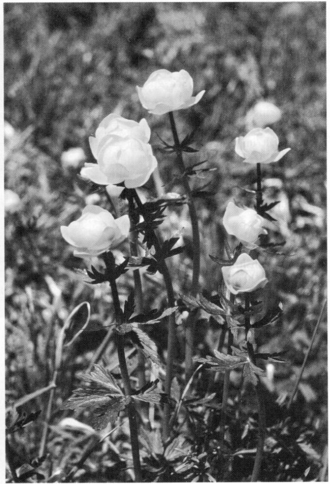
5 Trollblume ( Trollius europaeus )