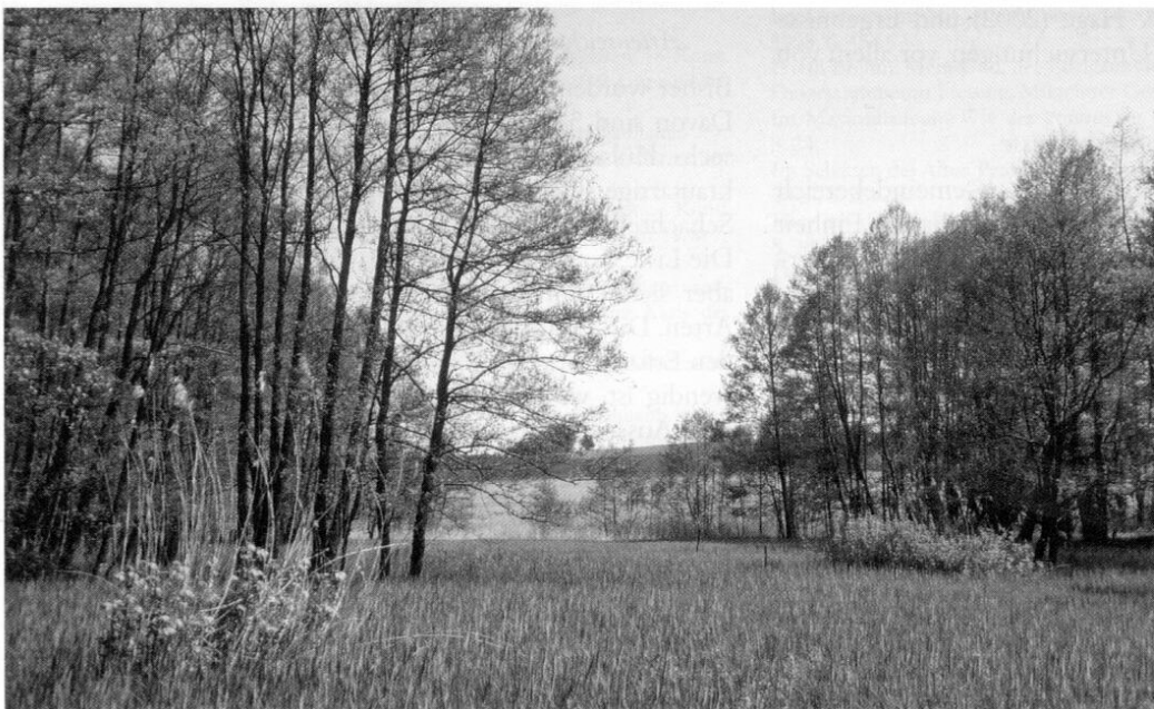
3 Streuwiese im Altgraben-Tal mit Johannisbeersträuchern als Vorposten des Waldes