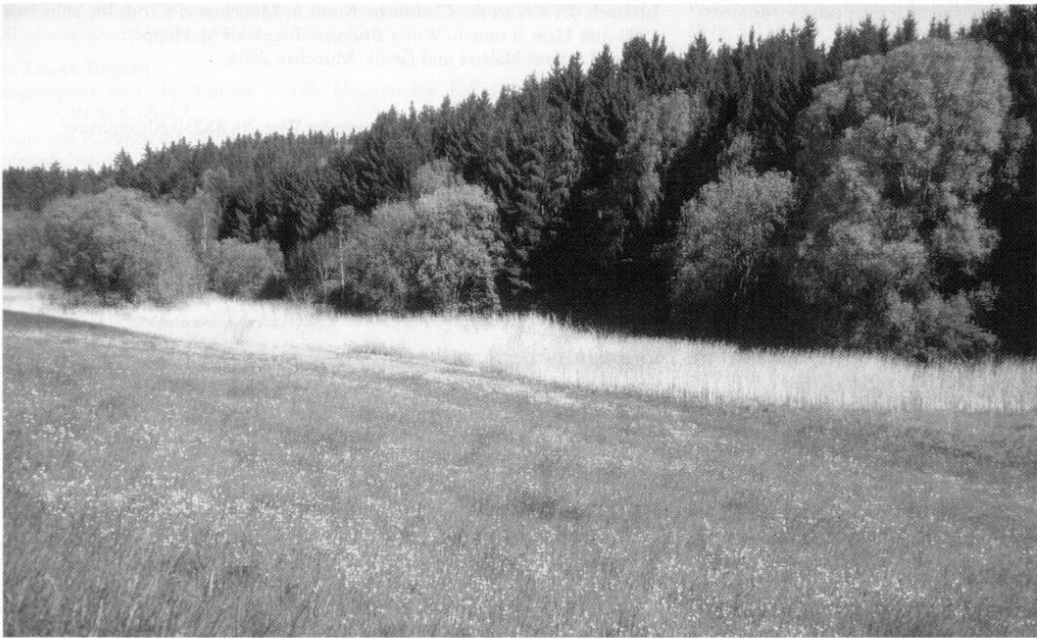
1 Westteil des Feuchtgebietes in einem asymmetrischen Tal