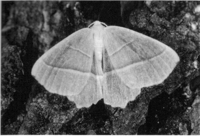
11 Spanner-Art ( Campaea margaritata )