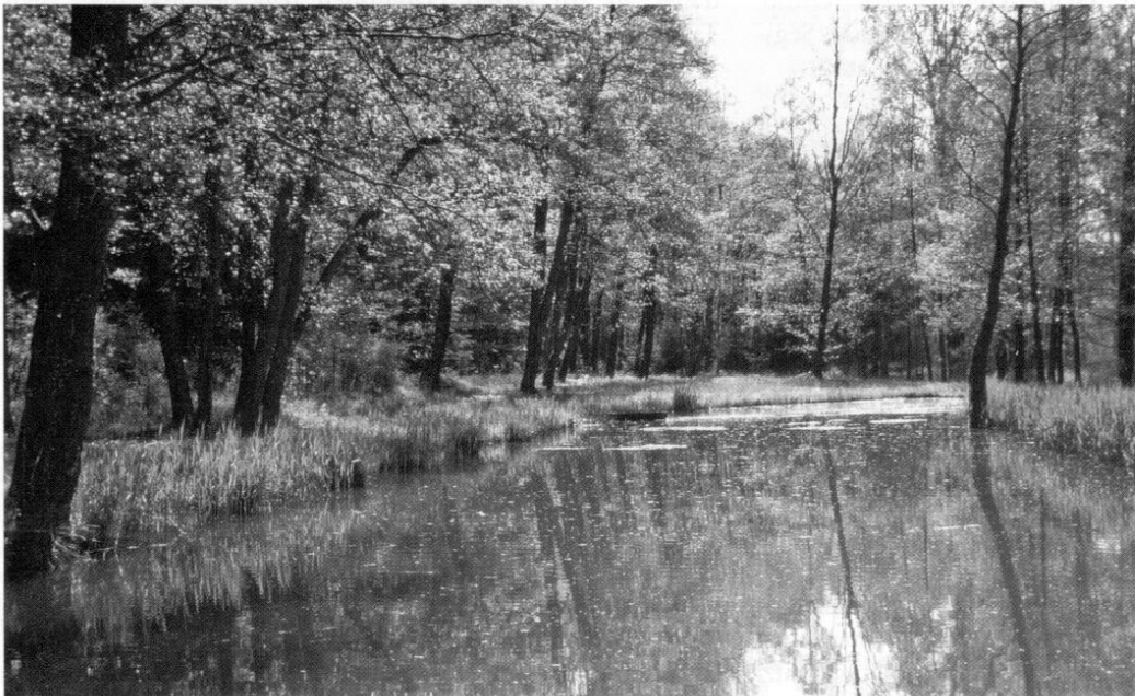
2 Teich oberhalb des Fahrweges