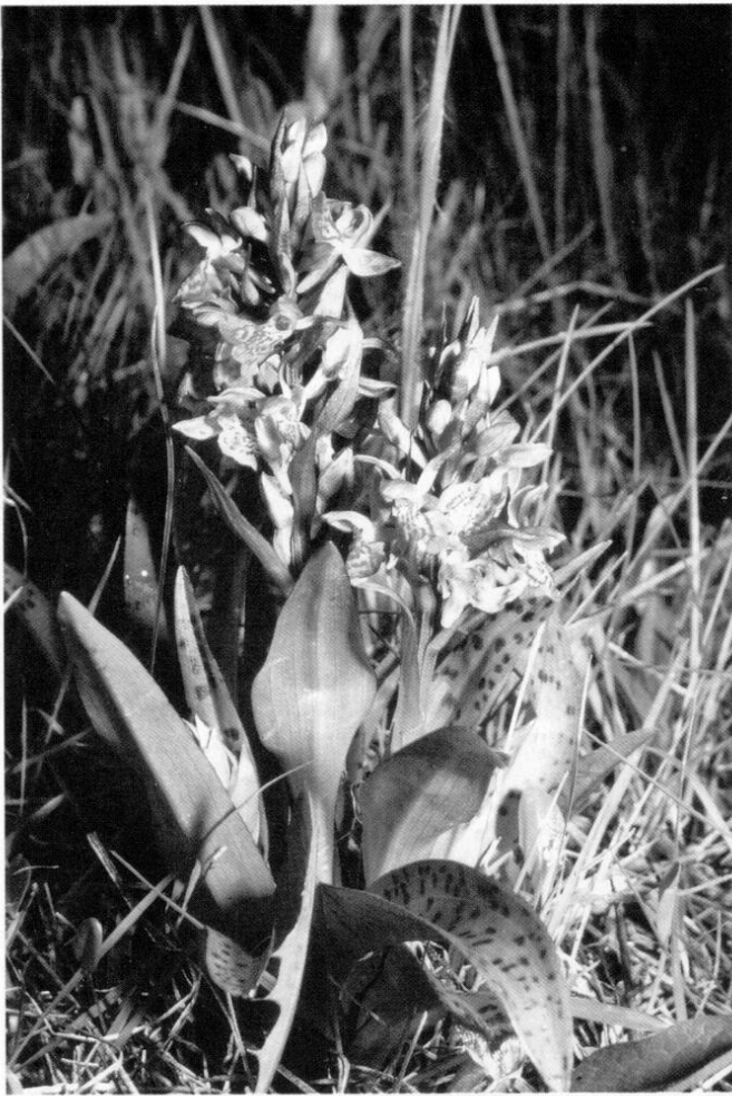
4 Breitblättriges Knabenkraut ( Dactylorhiza majalis )