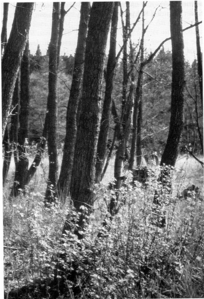
6 Schwarzerlen mit Johannisbeerstrauch