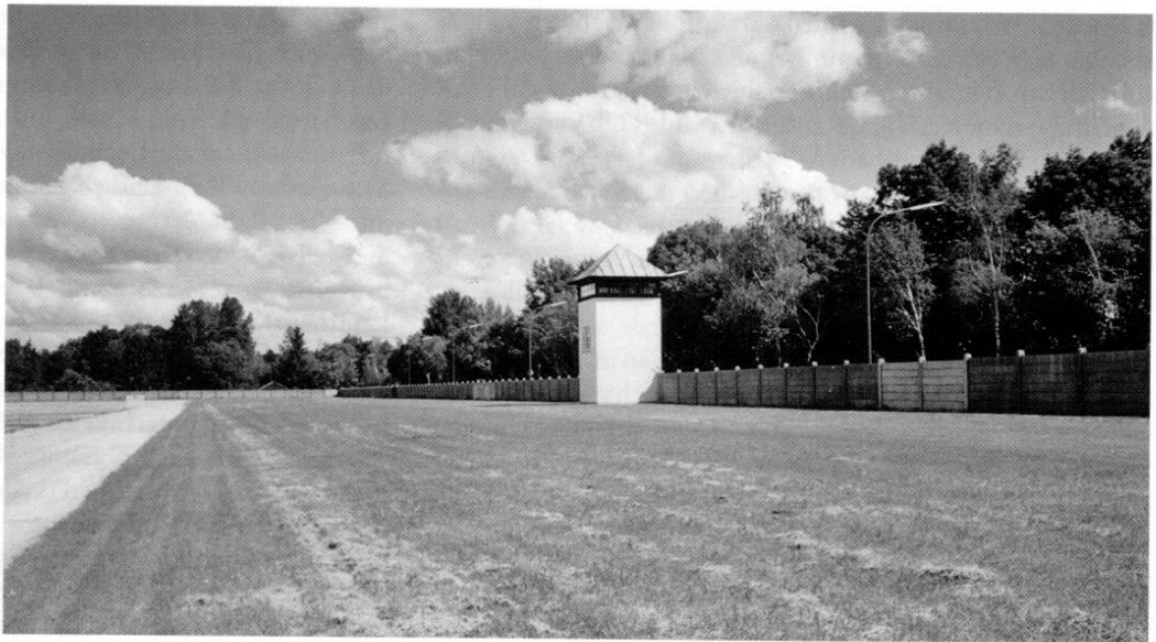
Rekonstruierte Ostmauer mit Wachturm

Finanzminister Eberhard mit jeweils der dringenden Bitte, zum Eucharistischen Weltkongress eine Feier der KZ-Priester im Lager Dachau zu ermöglichen. Roth ersuchte das Münchner Ordinariat, nachträglich eine Feier in das Programm des Kongresses aufzunehmen, weil bisher eine Feier in Dachau nicht vorgesehen war. 86