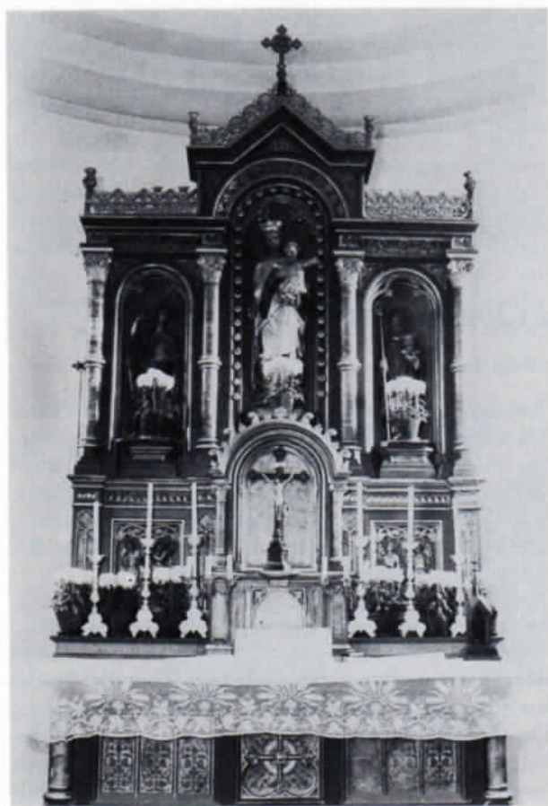
Der Hochaltar in Oberhummel.

Zu den beiden alten Glocken, die 1519 Leonhard Keller in München gegossen hatte und ca. 8 bzw. 6 Zentner