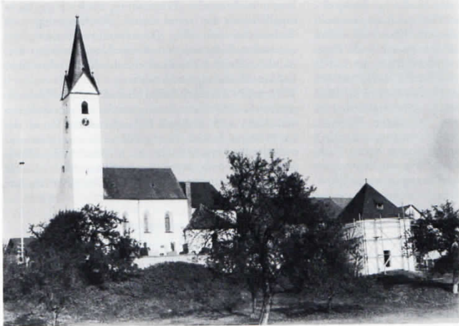
Südsicht der Pfarrkirche in Oberhummel.