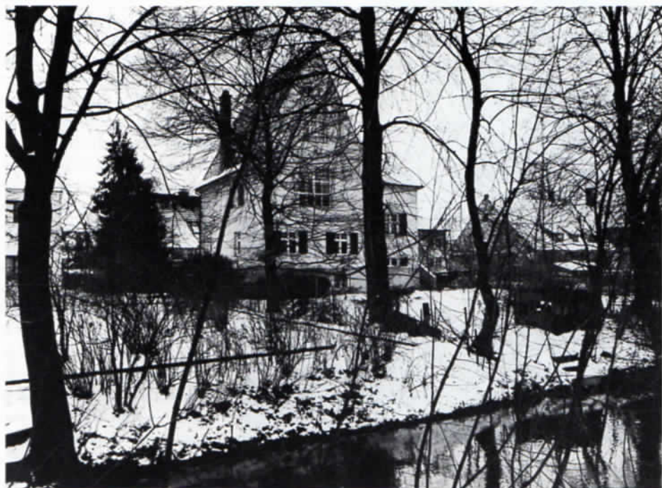
Abb. 1: Das Künstlerhaus Wilke in Dachau, Jahnstraße 1, vom Schleißheimer Kanal aus gesehen.