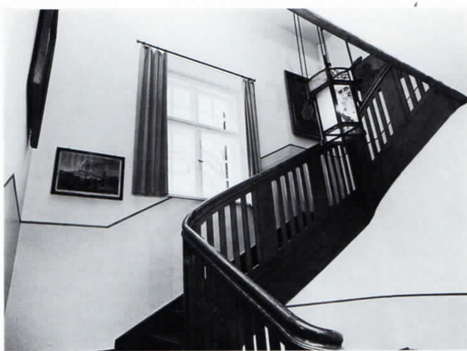
Abb. 3: Treppenhaus im Künstlerhaus Wilke, Dachau, Jahnstraße/Ecke Schleißheimer Straße (heutiger Besitzer: Ing. Erwin Auer).

gibt es Blumenstücke und Stilleben, also eine im Darstellerischen recht weit gespannte Kunst. Am prägnantesten scheint sich Wilke im Ölgemälde mittleren Formates auszudrücken. Hier kann man von einer gediegenen Maltechnik sprechen, wobei gediegen nicht mit bieder gleichgesetzt werden darf. Diese Gemälde sind so kulturvoll, daß sie sich vorzüglich gut eingetragenen Wohnräumen eingliedern lassen. Wiederum aber wäre es diesen formalen Werten gegenüber verkehrt, etwa von Salonkunst zu sprechen. Es handelt sich nicht um äußerliche Eleganz, der Künstler bleibt immer Diener an seinem Darstellungsobjekt.