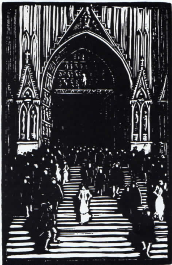
Abb. 5: Goethe »Faust«, Illustration von Walther Klemm, 14 x 9,2 cm.

Für die Ermittlung der Verlagsproduktion gibt es zwei Quellen. Einmal stets die letzten Seiten eines beliebigen Einhorn-Buches, weil diese zu Verlagsanzeigen ausgenutzt waren. Die zweite Quelle: etwaige Anzeigen in der Monatszeitschrift »Der Bücherwurm«, auf die wir später zu sprechen kommen. Bei aller Bemühung, diese beiden Quellen aufeinander abzustimmen und sie zu benutzen, erfährt man bald, daß sich auf diesem Wege, namentlich durch das Fehlen der Herausgabebezahlen, etwas eindeutig Genaues, wissenschaftlichen Ansprüchen Entsprechendes nicht erzielen läßt. Plötzlich stellt sich auch noch eine neue Schwierigkeit ein: unter die die Literatur betreffenden Buchtitel mischen sich solche, die geschichtliche Werke meinen, wie z. B.