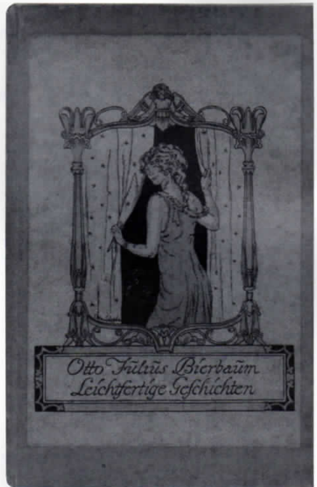
Abb. 3: Beispiel für »Die bunten Einhorn-Bücher«, 16,5 x 10,5 cm. Hier eine Einbandgestaltung von Franz Christophe.

Die eigentlichen Geschäftsräume Blumtritts befanden sich ebenfalls in der Kurfürst-Karl-Theodor-Straße, nur etwas mehr stadtwärts, in Nummer 5. Auch dieses Haus, mit dem für die Künstlerkolonie charakteristischen Fachwerk, steht nicht mehr, es ist einem Appartementhaus gewichen.