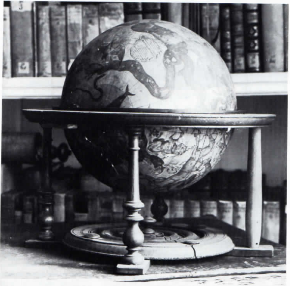
Abb. 2: Indersdorfer Himmelsglobus in Straubing.

Will man versuchen, über die Herkunft dieser Gegenstände etwas auszusagen, so muß man zunächst besondere Stücke betrachten, die aus dem gewöhnlichen Rahmen einer solchen Sammlung fallen. Im Verzeich-