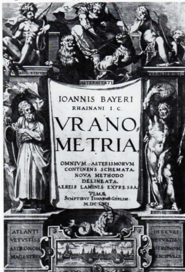
Abb. 1: Titelblatt eines astronomischen Werkes aus Indersdorf im Straubinger Gymnasium.

Vergleicht man darüber hinaus das Indersdorfer physikalische Gesamtinventar von 1783 mit dem Straubinger Verzeichnis von 1808, so finden sich sämtliche Straubinger Maschinen, die nicht aus Oberaltaich stammen, auch im Indersdorfer Verzeichnis vor – von der Federwaage zum Wasserhammer, vom Aräometer zur hydrostatischen Waage, von den Feldmeßinstrumenten zur Stoßmaschine, vom Mikroskop zur Sonnenuhr. Dabei fällt auf, daß sich die Verzeichnisse weitgehend decken und nicht nur eine mehr oder minder große Zahl von Apparaten gemeinsam aufweisen.