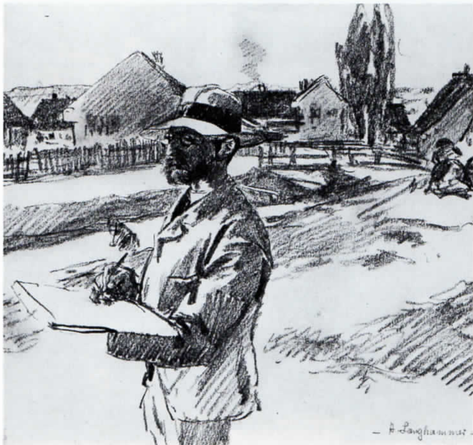
Abb. 1: Arthur Langhammer: Adolf Hölzel zeichnend in Dachau. Blei, 21,5 x 23,5 cm. Staatsgalerie Stuttgart, Inv.-Nr. C 51/337.

Adolf Hölzels Leben bis zu seinem Eintritt in Dachau war wie folgt verlaufen: Geboren am 13. Mai 1853 in Olmütz in Mähren als Sohn eines Verlagsbuchhändlers. Besuch des Gymnasiums in Olmütz. 1871 über-