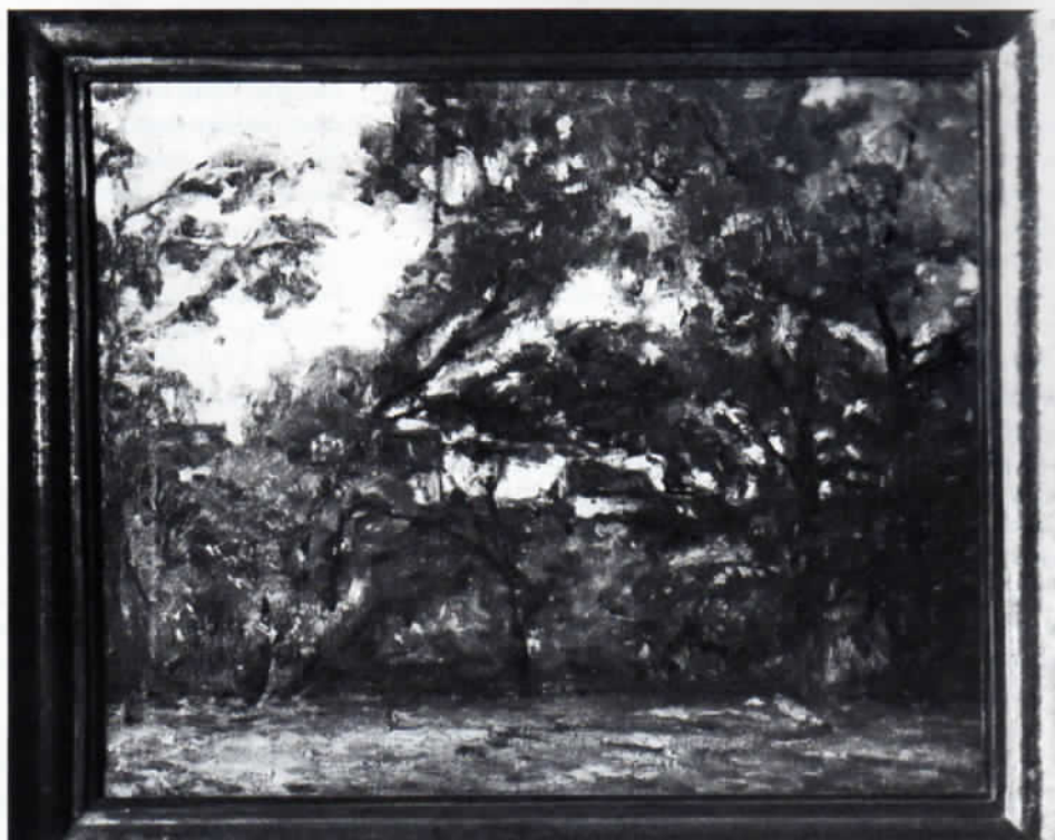
Abb. 4: Adolf Hölzel: Landschaft mit Weiber bei Dachau. Öl auf Leinwand, 68 x 84 cm. Museumsverein Dachau.

Das Genrebild verliert sich jetzt in Hölzels Schaffen. Er malt Dachauer Ansichten und, angeregt durch Ludwig Dill (1848–1940), der 1894 in Dachau einzieht, auch Moosbilder. Alle diese Werke sind sehr verschiedener Art; man fühlt, wie er dauernd auf der Suche nach einem Stil ist (Abb. 4).