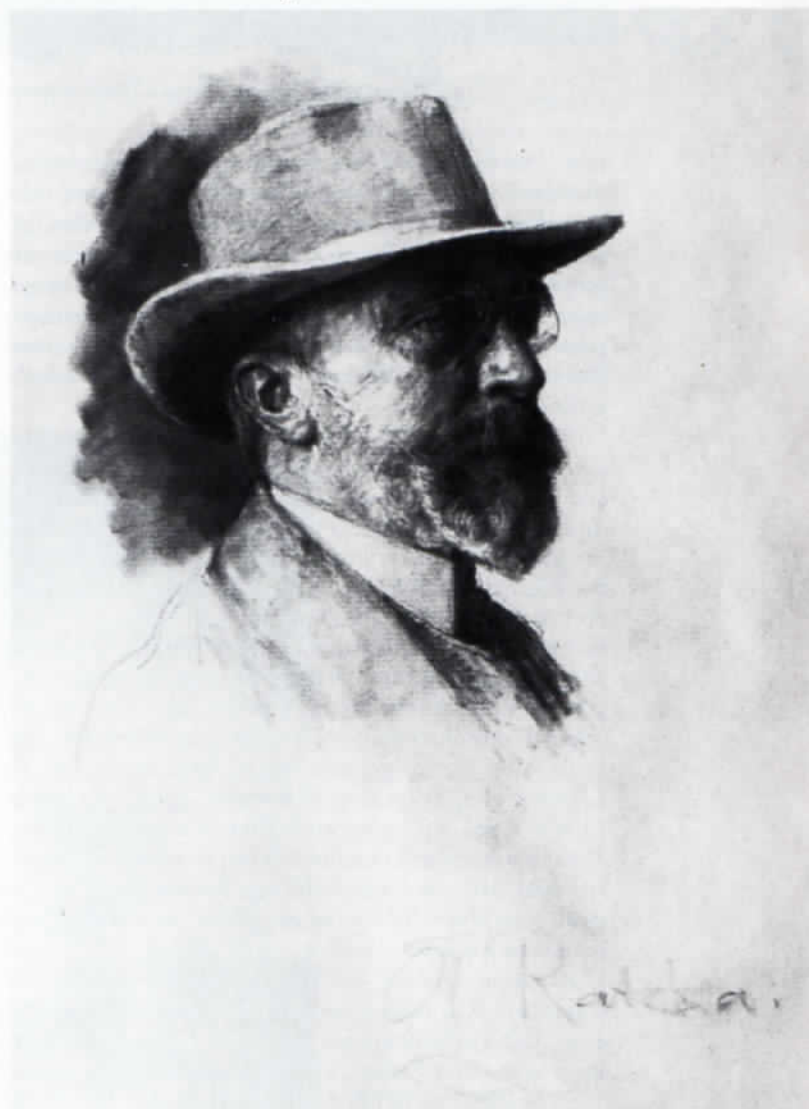
Abb. 1: Arthur Ludwig Ratzka: Adolf Hölzel. Kohle, 49 x 38 cm. Museumsverein Dachau.

Hölzels Unterricht in Dachau dürfte wesentlich anders gewesen sein als sein Lehren später in Stuttgart, welches ja auf den Dachauer Erkenntnissen aufbaute. Er hat in Dachau seine Lehre von den künstlerischen Mitteln entwickelt, deren es bedarf, um eine Darstellung zum Kunstwerk werden zu lassen. »Das Dargestellte im Bilde hängt mit der Natur zusammen, die künstlerische Darstellung mit den künstlerischen Mit-