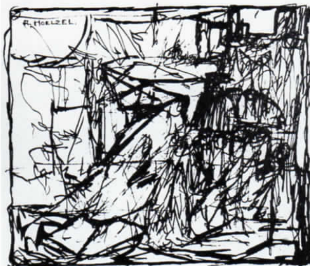
Abb. 5: Adolf Hölzel: Figuren-Komposition (1916). Feder, 21,1 x 26,5 cm.

trationslager); Lüty, Max (geboren 1859, Königsberg); Stenner, Hermann (geboren 1871, Bielefeld, gefallen 1914); Weber, Therese II. (geboren 1864, München); Wimmer, Fritz (geboren 1879, Rochlitz/Sa.).