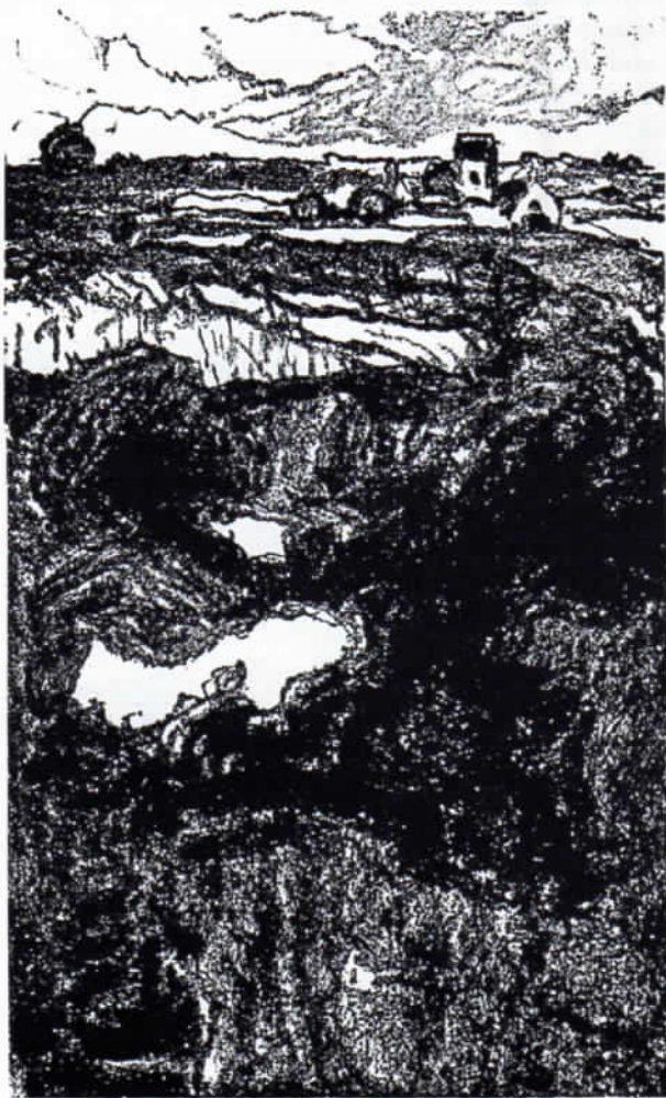
Abb. 3: Adolf Hölzel: Illustration zu Ludwig Thomas »Agricola«, Zeichnung.

Noch einmal zurück zur »Frau des Zimmermanns«, Maria. Es ist das Beseeltste aller Hölzelschen Gemälde, es liegt ein Schimmer tiefer Religiosität über dieser Darstellung. Religiöse Vertiefung wird man ja auch bei dem späten Hölzel vielfach finden, es ist dies eine besonders zu beachtende Seite seines Schaffensdranges. Im Falle der »Zimmermannsfrau« glauben wir an