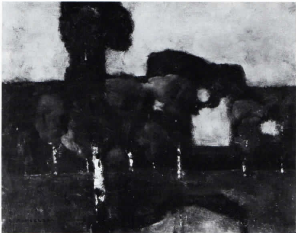
Abb. 3: Adolf Hölzel: Birken im Dachauer Moos (1902), Öl, 39 x 49 cm. Mittelrheinisches Landes- museum Mainz, Inv. Nr. 796.