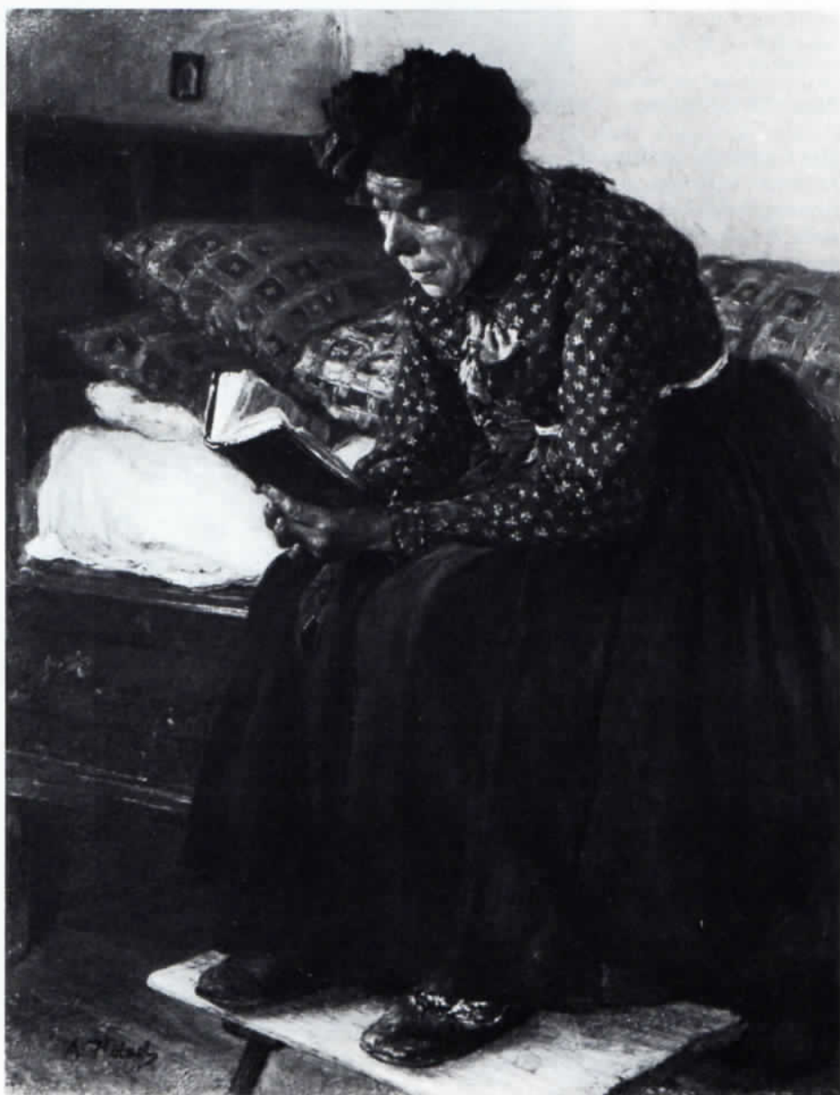
Abb. 2: Adolf Hölzel: Hausandacht, Öl, 40 x 22 cm. Bayerische Staatsgemälde- sammlung, München.

ortsansässigen Malern wollte und deren »Stammische« besuchte. Die Anwesenheit Thoma in Dachau dauerte dann nur drei Jahre: am 1. April 1897 bereits übersiedelte er nach München. Aber in die Dachauer Zeitspanne war doch das Erscheinen von Thomas dichterischem Erstlingswerk gefallen: unter dem Namen »Agricola« zusammengefaßte Bauerngeschichten (erste Auflage 1897). Das Buch sollte illustriert werden, wozu Verlag und Autor den 1874 geborenen – also sehr jungen – Simplizissimuszeichner Bruno Paul einerseits und Adolf Hölzel andererseits beriefen. Bruno Paul, hervorragender Karikaturist, hat hier großartige Bilder aus dem Bauernleben zugesteuert. Hölzel, dem vornehmen Mann aus Mähren, war das bayerische Bauerntum fremd geblieben und so ergänzte er den Bilderschatz nur durch rein landschaftliche Zeichnungen. Wir besitzen in ihnen feine Darstellungen aus dem noch ganz urtümlichen Dachauer Moos (Abb. 3). Hölzels Vordringen in das Illustrative war aber kein Erfolg und wiederholte sich nicht.