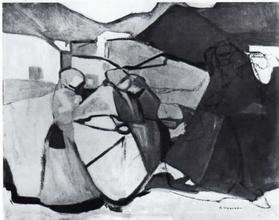
Abb. 5: Adolf Hölzel: Komposition in Rot I (1905). Öl, 68 x 85 cm.

Hölzel bleibt weiter in unentwegtem Schaffen, nach außen hin ein heiterer, zugänglicher Mann in glücklicher Ehe und in geordneten Verhältnissen. So wenigstens verlaufen seine Tage. Was weiß man von seinen Nächten? Verbrachte er sie in Grübeleien, Versuchen, Niederschriften? Denn irgendwann müssen doch die ungeheueren Spannungen seines Inneren ausgetragen worden sein. Konnte er seine »Komposition in Rot I«