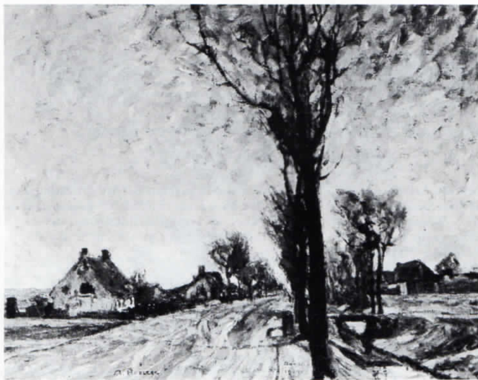
Abb. 4: Adolf Hölzel: Dachau, Schleißheimer Straße (1904). Öl, 65 x 85 cm. Mittelrheinisches Landesmuseum Mainz, Inv. Nr. 932.