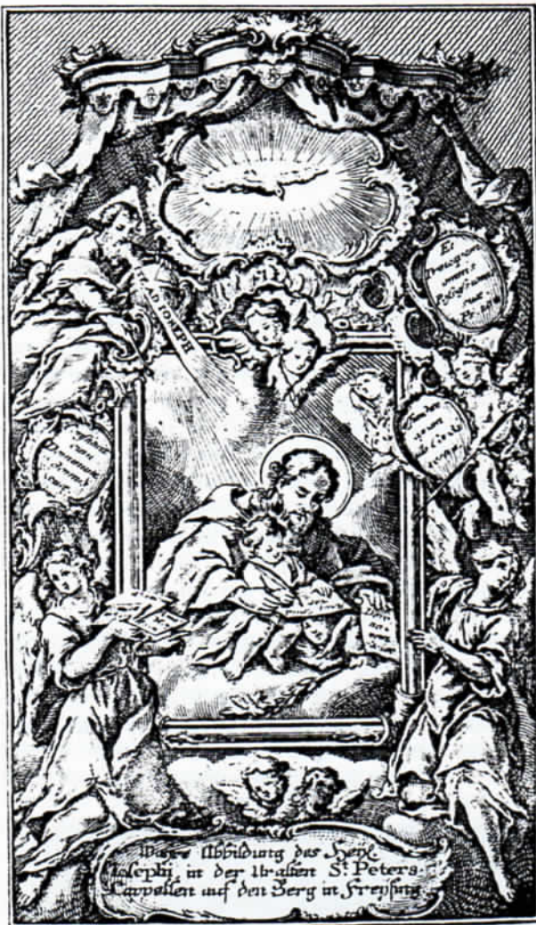
105. Unterleutner des Abb. 5: Für den Klauserschen Kupferstich zum Josephsbild der ehemaligen Peterskapelle auf dem Freisinger Domberg schuf Unterleutner die Vorlage.

Wir haben sicher keinen großen Meister der Malerei beschrieben – aber das wollte Unterleutner wahrscheinlich auch gar nicht sein. Denn er stellte seine Aufgabe in den Dienst der Kirche, er wollte den Gläubigen, die ihm die Aufträge zukommen ließen, gutes Anschauungsmaterial liefern, das das Leben der bib-