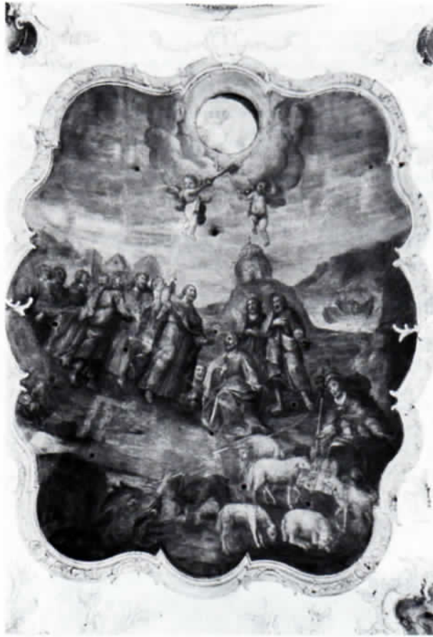
Abb. 2: Eines der Deckengemälde Unterleutners in Lengdorf.