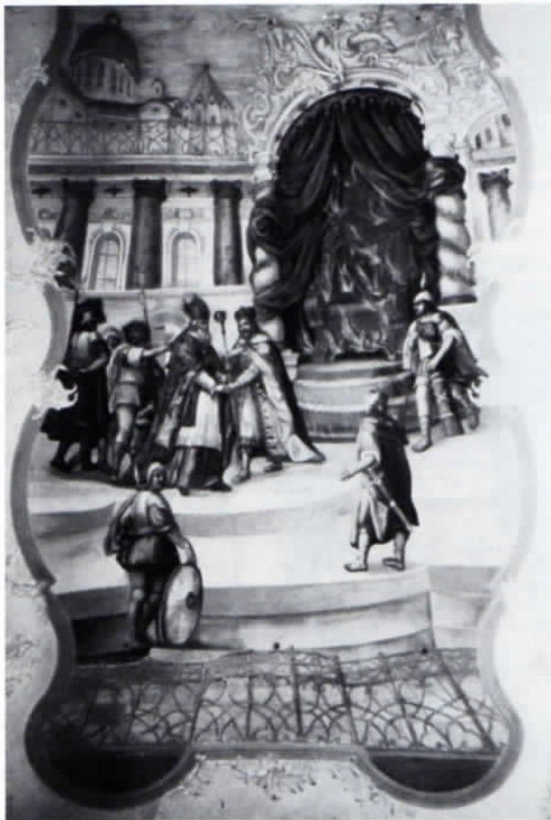
Abb. 3: Unterleutners Deckengemälde im Langhaus der Pfarrkirche Niederding.

Unterleutner hatte in Lengdorf zwei große Deckengemälde im Langhaus geschaffen: die Kreuzigung des hl. Petrus und die Schlüsselübergabe durch Christus an Petrus (Mt 16, 18–19) mit den seitlichen Verweisen auf den Fels (= Kirche), das Schiff, Petrus als Papst (mit den Gesetzestafeln zu Füßen) und die Böcke und Schafe, die dem Angriff des Bösen ausgesetzt sind (Abb. 2).